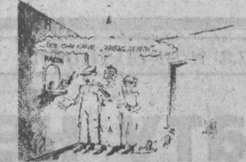
«Зарплату не спрашивай, а пени плати», — так ставит вопрос Кемеровская администрация Рис. Андрея Горшкова.