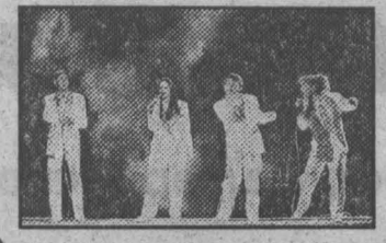
«Поколение — Кузбасс-97» — второй областной музыкальный фестиваль молодежных коллективов и молодых исполнителей берет старт Фото Александра Блотникова.