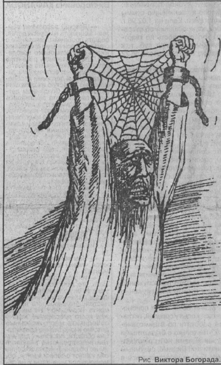
Рис. Виктора Богорада.