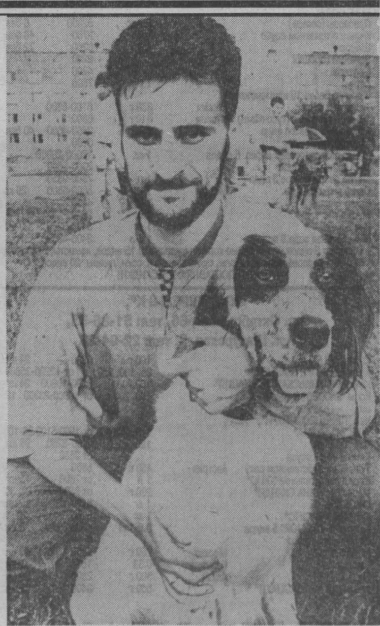
получила кубок. Второе и третье места разделили соответственно общества Яшкинское районное и Прокловское городское. Выставка закончилась, впереди открытие сезона охоты на водоплавающую дичь. К. СЕРГЕЕВ.

Максимум внимания уделяется собаководству в Кемеровском городском обществе охотников и рыболовов (председатель Г. К. Тогурев). Недалеко за нынешнюю победу эта команда, заняв первое место,