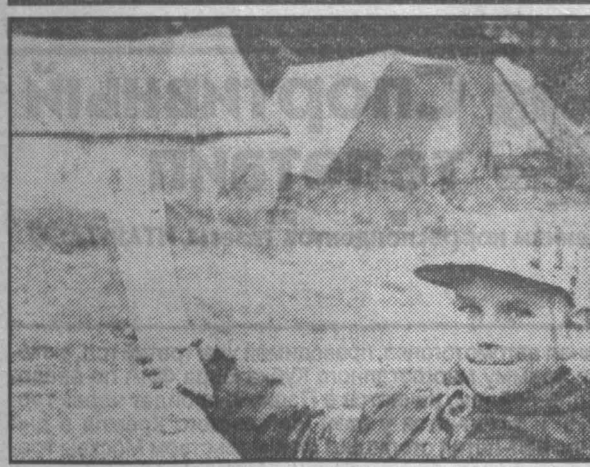
НА СНИМКАХ: один из участников совместной палеонтологической экспедиции; на раскопках древних поселений в районе села Шестаково.