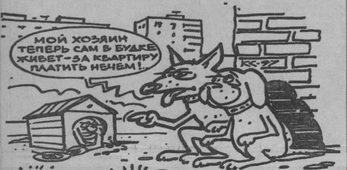
Рис. Вячеслава Капрельянца.