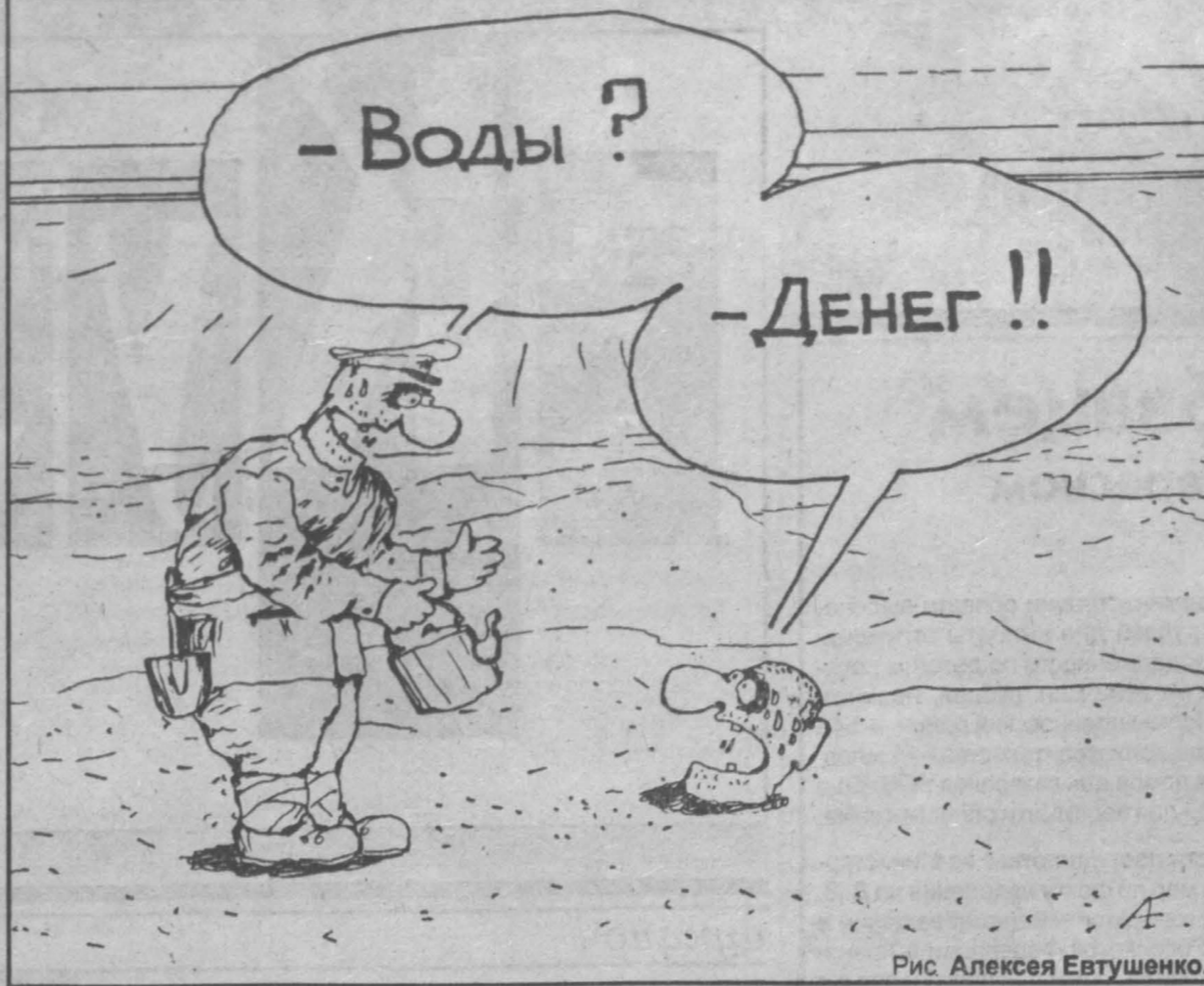
Рис. Алексея Евтушенко.