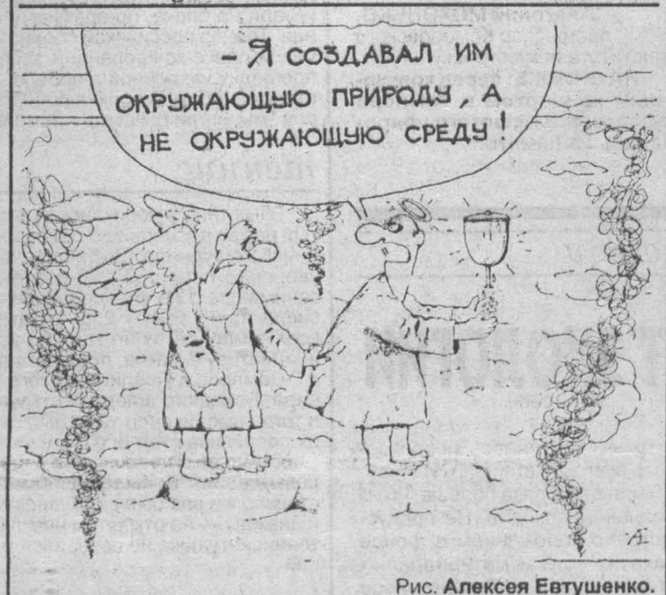
Рис. Алексея Евтушенко.