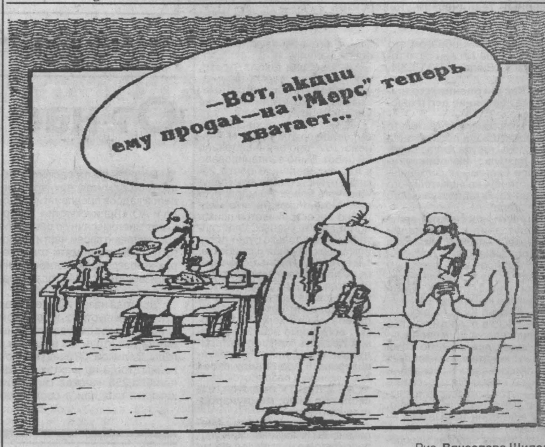
Рис. Вячеслава Шилова.

ле ответного снижения цен потребителями. То есть проявилась тенденция общего падения цен, за счет чего можно уже во второй раз урезать стоимость кВт.ч. Есть, кстати, потенциал для снижения его стоимости и в IV квартале за счет более дешевого топлива.