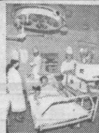
Наши достижения в медицине почти на уровне европейских — так считают ведущие специалисты.

В Кемеровском музее изобразительных искусств открывается выставка работ Василия Кравчука.