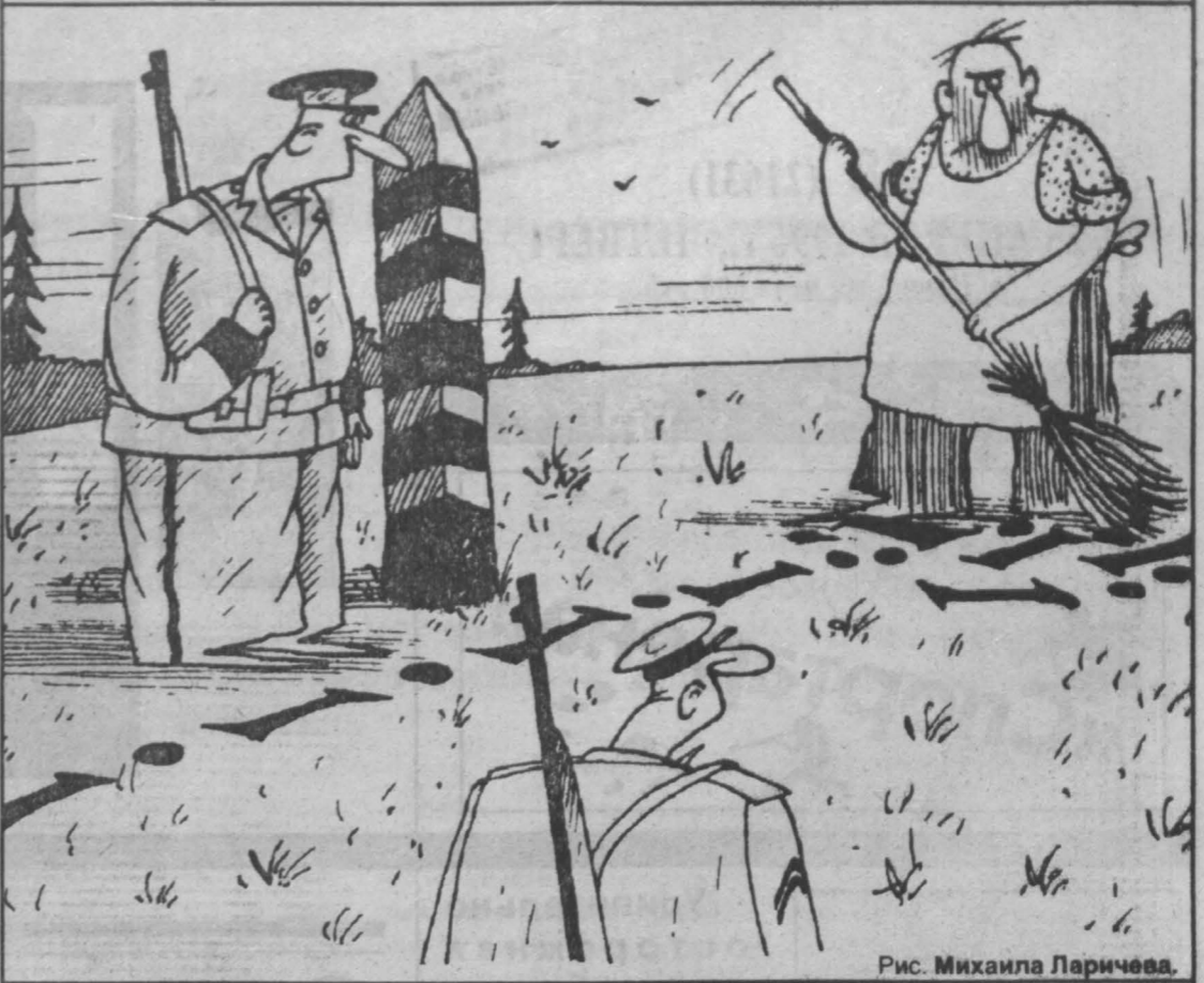
Рис. Михаила Ларичева.