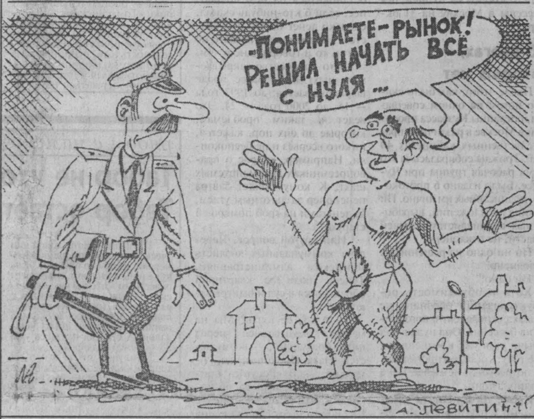
Рис. Александра Левитина.