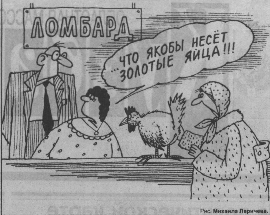
Рис. Михаила Ларичева.