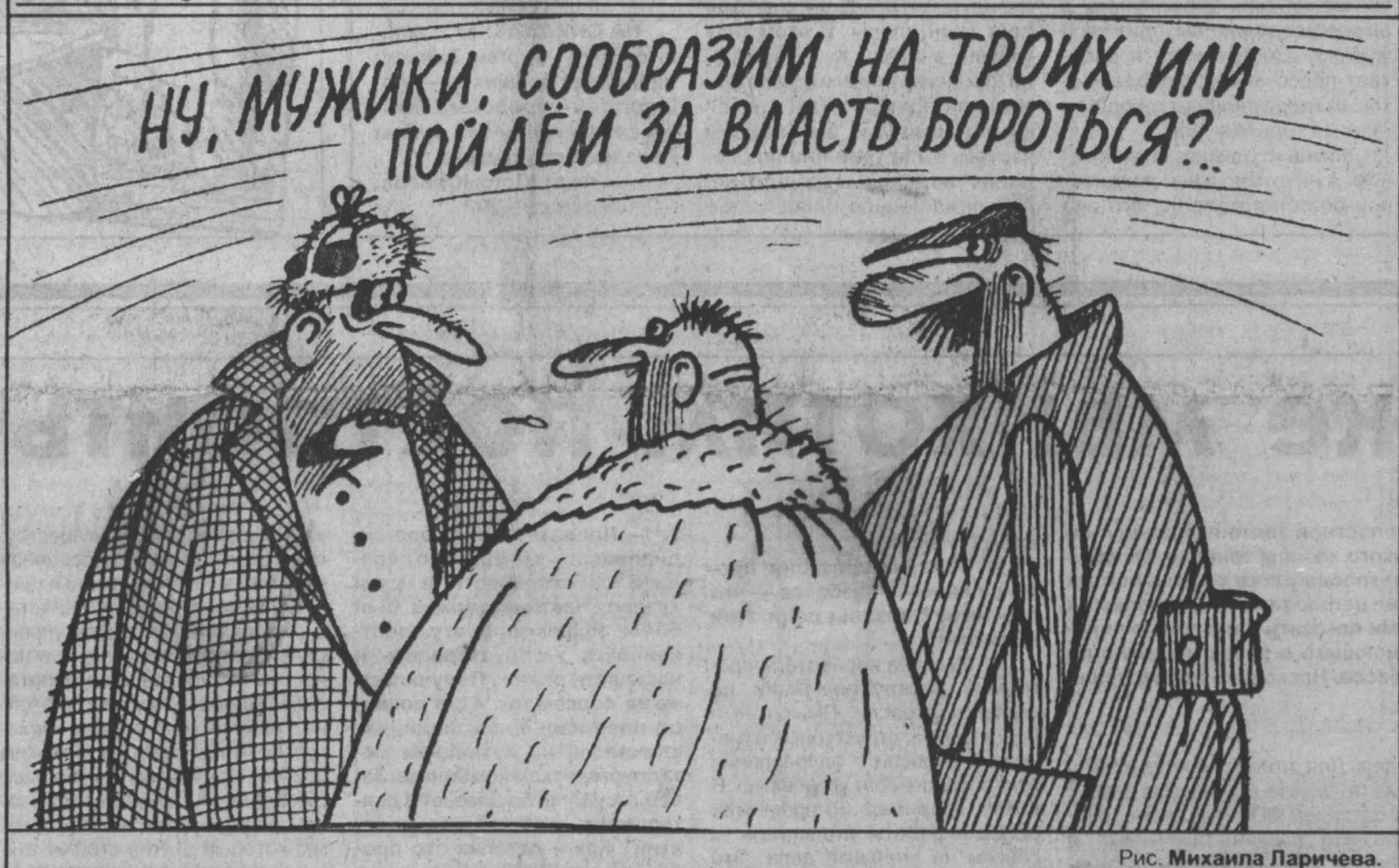
Рис. Михаила Ларичева.