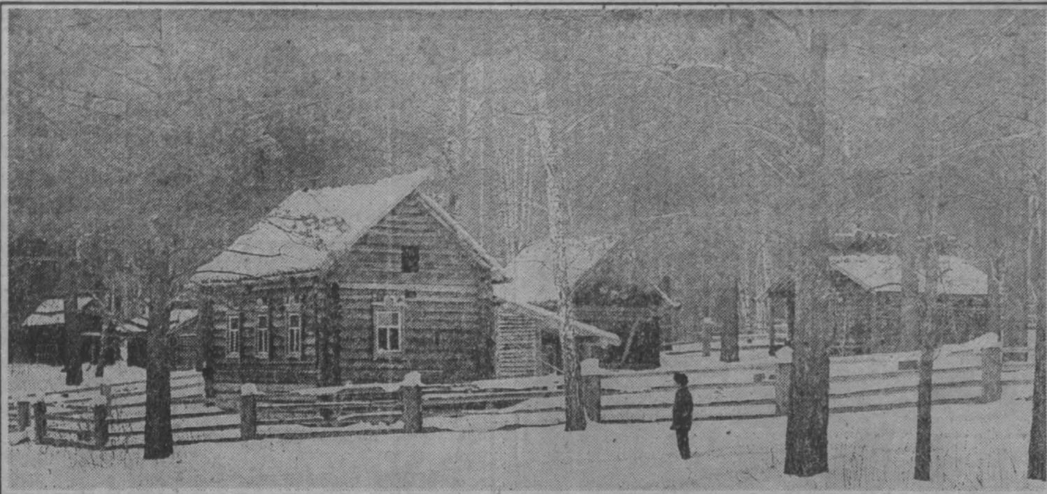
история родного края