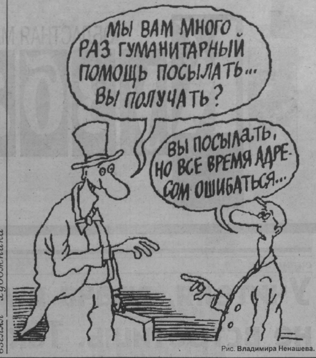
Рис. Владимира Ненасева.