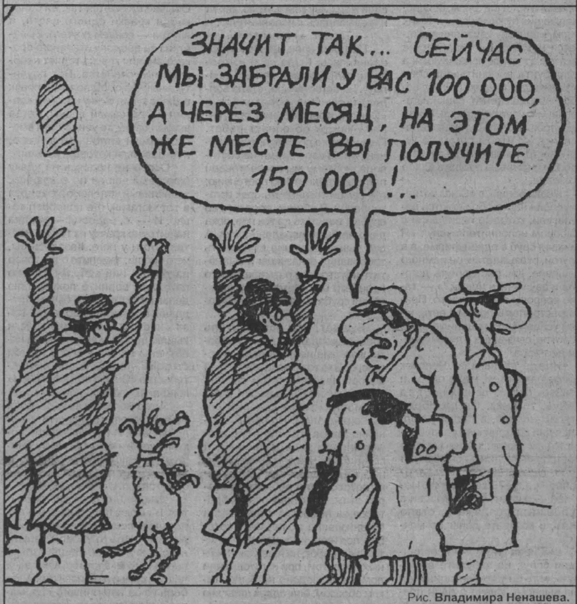
Рис. Владимира Ненашева.