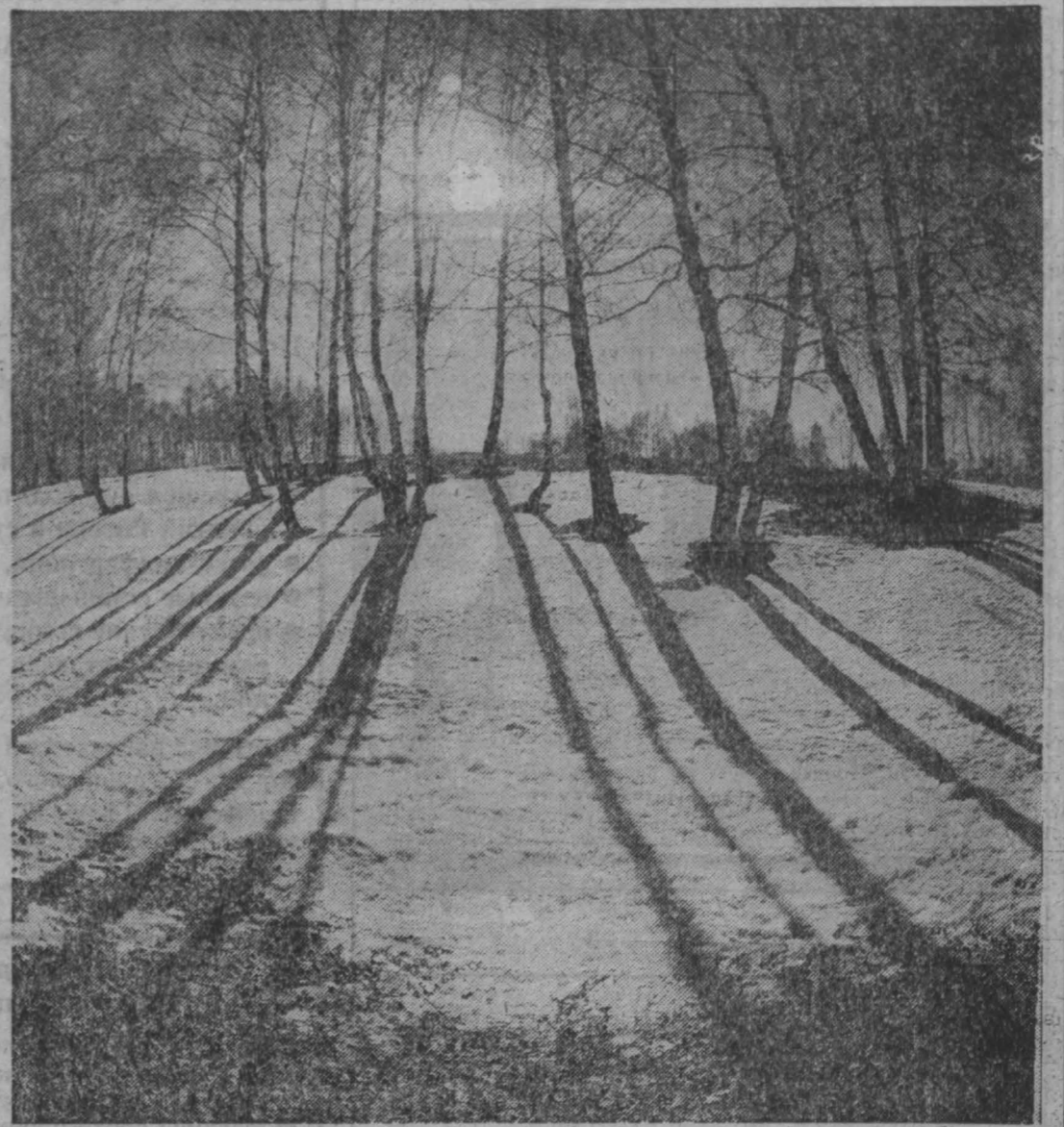
даль в мартовский лес: снежно-зимнему свежо, но стоит перейти на солнечный склон, спуститься на лыжах по нему вниз, в расплод, и услышишь глуховатый шорох под снегом

новым огнем, а тени гаснут. Еще одно явление марта Небо разукрашивается кудрявыми кучковыми облаками