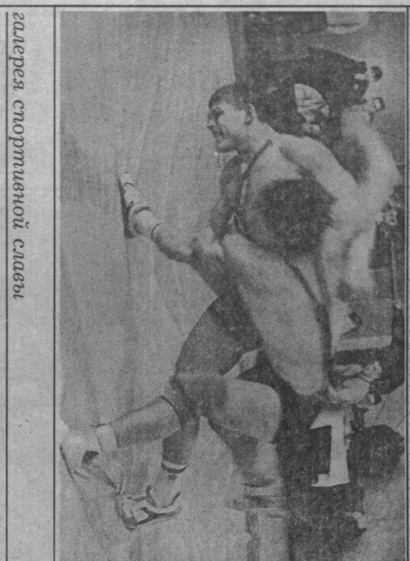
Залезая стормашной славы