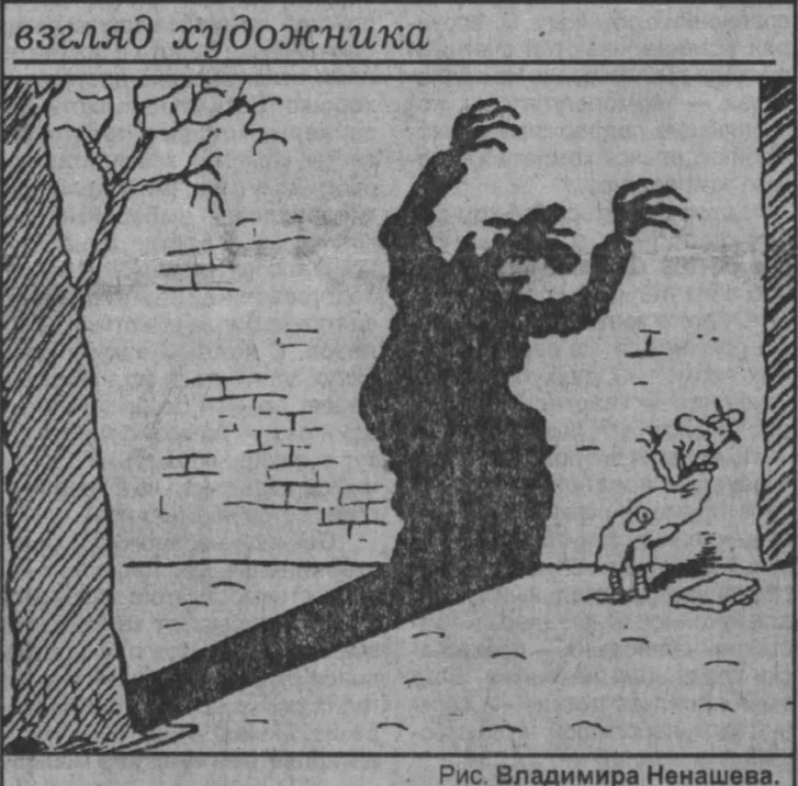
Рис. Владимира Ненашева.

Завтра в «Кубзбассе»: • тематический выпуск «Край родной»; • адрес интересного опыта; • дорога, пешеход, транспорт.