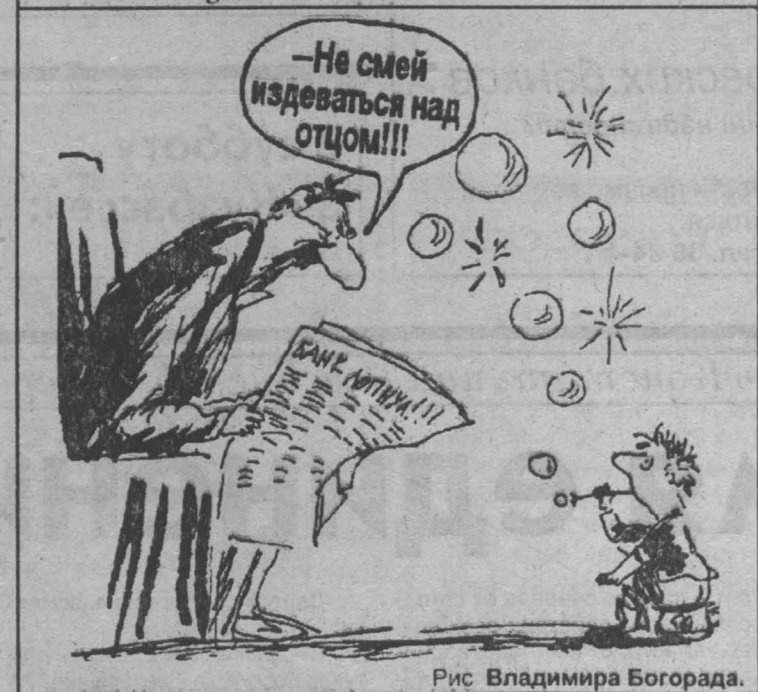
Рис. Владимира Богорода.

уровня 1,66 до отметки 1,69 или почти на шесть процентов. Во вторник агентство Рейтер опубликовало сообщение, согласно которому министр финансов Великобритании заявил, что избыточность фунта стерлингов создаст серьезные трудности для британской промышленности. В результате к концу недели фунт стерлингов закрылся на отметке 1,65.