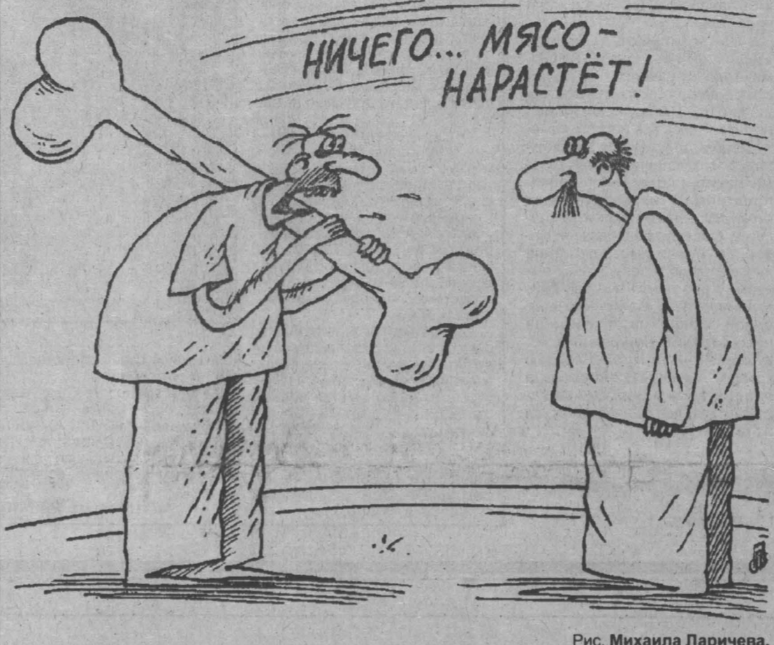
Рис. Михаила Ларичева.