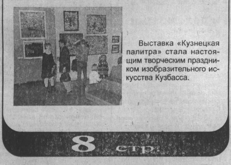
Выставка «Кузнецкая палитра» стала настоящим творческим праздником изобразительного искусства Кузбасса.