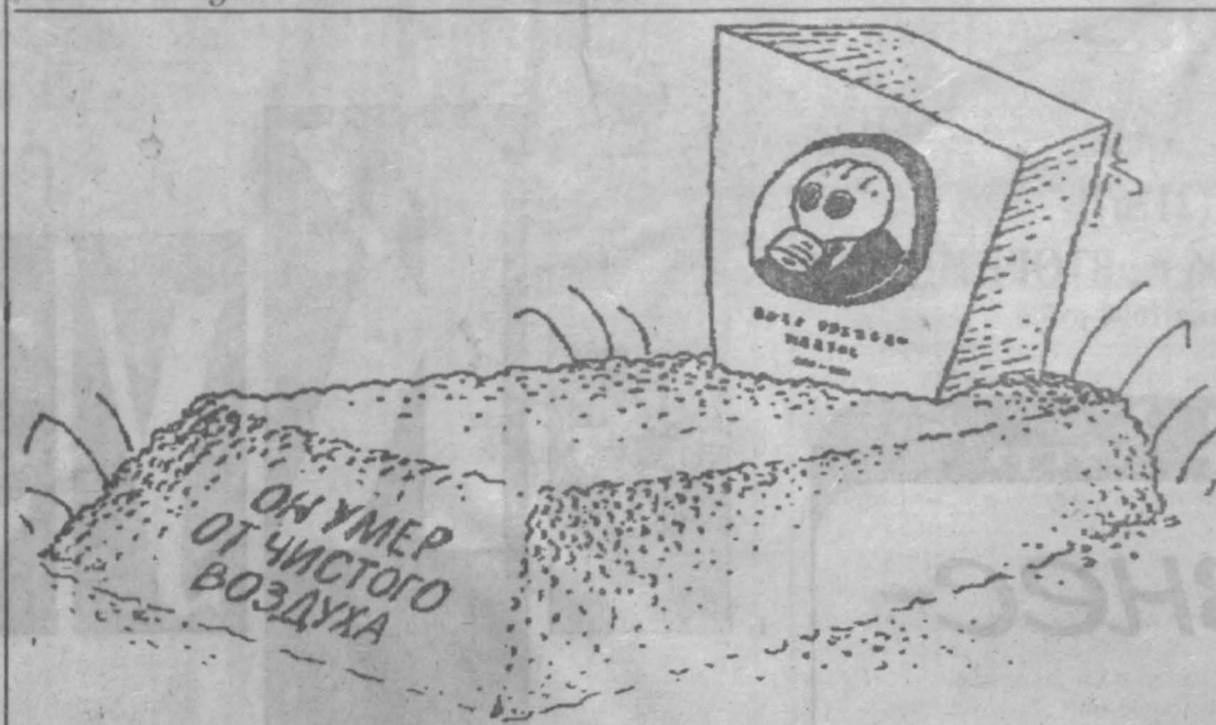
Рис. Игоря Кийко.