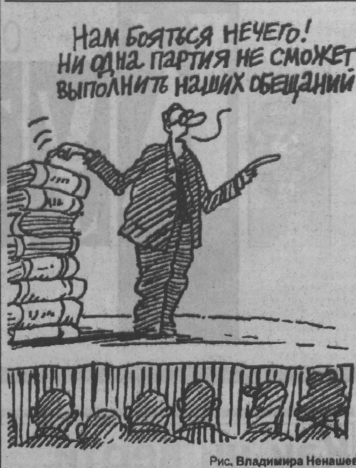
Рис. Владимира Ненашева.