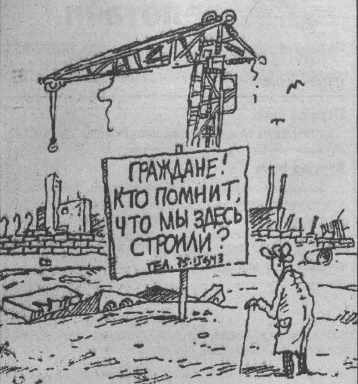
Рис. Владимира Немашева.