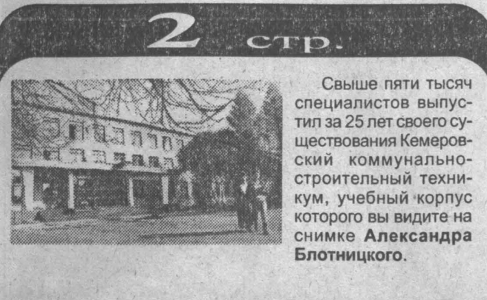
Свыше пяти тысяч специалистов выпустил за 25 лет своего существования Кемеровский коммунально-строительный техникум, учебный корпус которого вы видите.