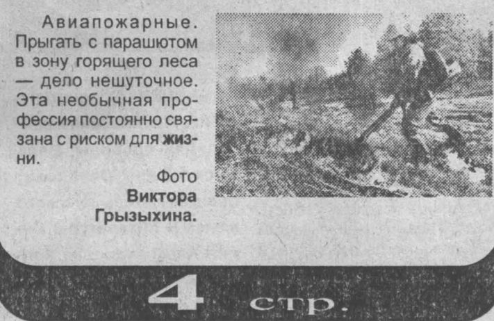
Авиапожарные. Прягать с парашютом в зону горящего леса — дело нешуточное. Эта необычная профессия постоянно связана с риском для жизни.