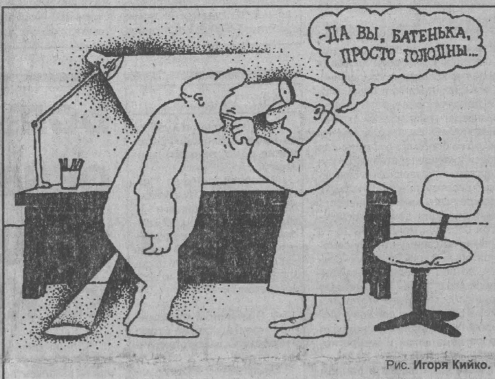
Рис. Игоря Кийко.

«В случае невыполнения требований объявить 5 ноября 1996 года с 7 часов Всерос-