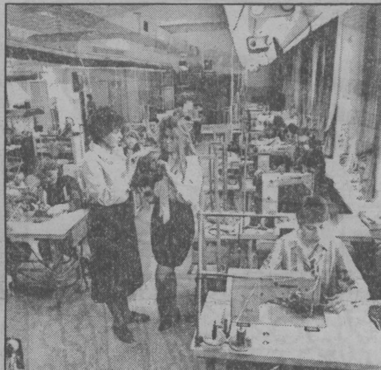
г. Кемерово.

Кроме основной базы, что на Южном, есть еще три цеха, работающие с населением по индивидуальным заказам. Для инвалидов, пенсионеров и многодетных семей предоставляется скидка до 10 процентов. Наибольший спрос имеют «чешки» для школьников и теплые тапочки для пожилых людей. Находясь в тяжелых финансовых условиях, руководство фирмы идет на снижение стоимости своих изделий. По линии социальной