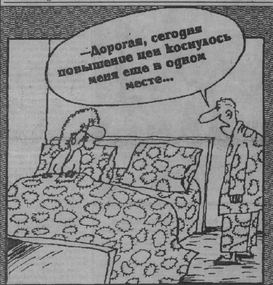
Рис. Вячеслава Шилова.