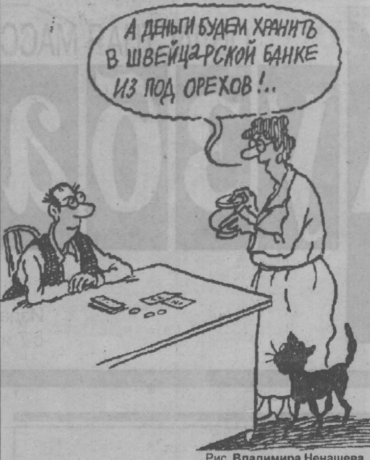
Рис. Владимира Ненашева.