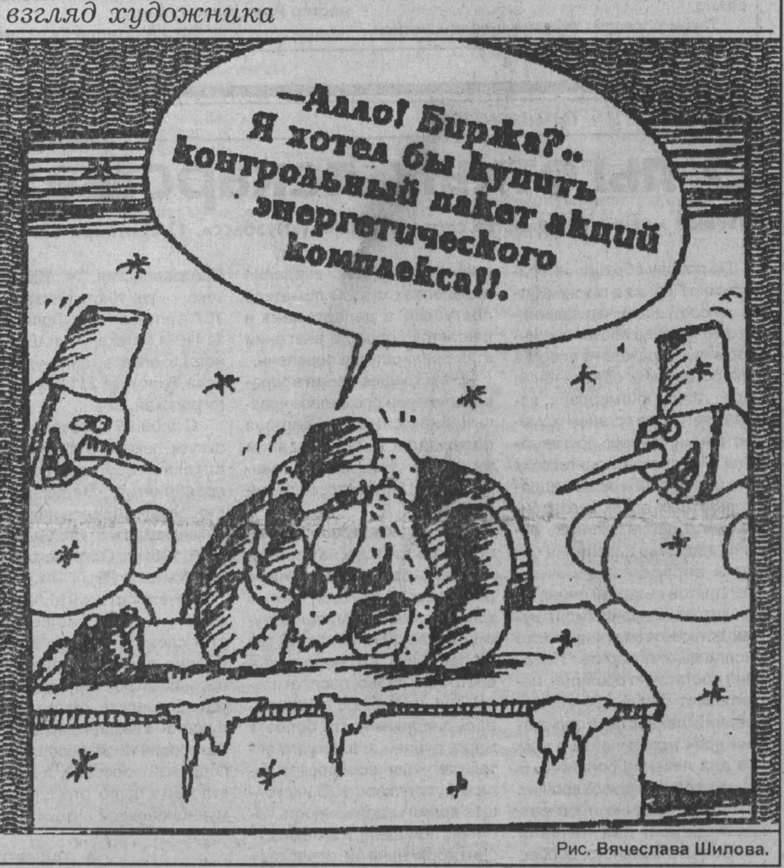
Рис. Вячеслава Шилова.

Студенты не по карману обанкротившемуся государству, которое не может выделить вузам деньги даже на тепло и воду