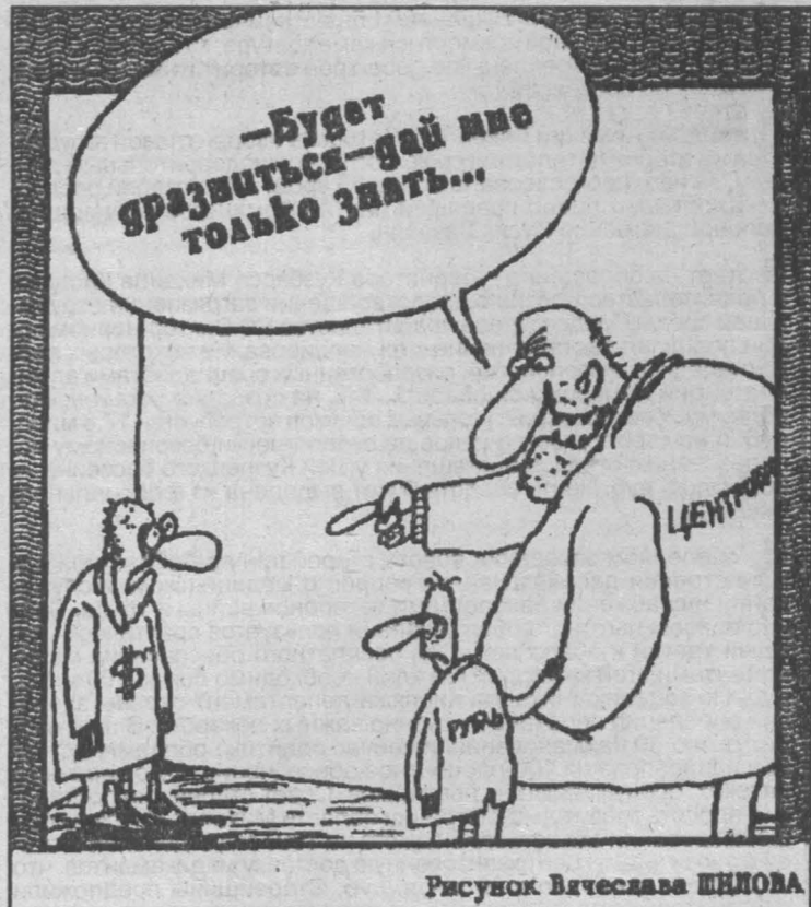
Рисунок Вячеслава ШИЛОВА.