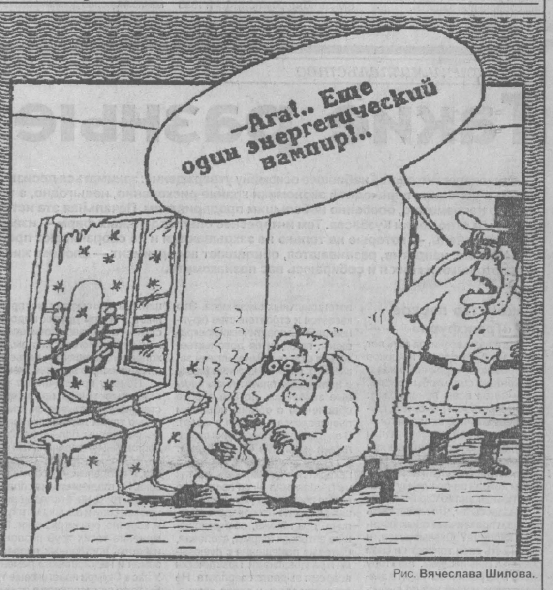
Рис. Вячеслава Шилова.

приводит к затягиванию ремонта, снижению качества, что на объектах, питающих теплом и светом города и предприятия, чревато самыми драматичными последствиями.