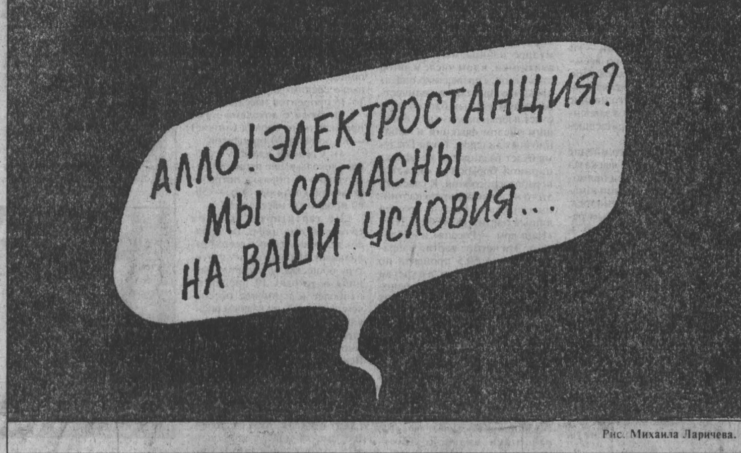
Рис. Михаила Ларичева.

Причина, как уже сообщалось, одна — «Кузбассэнерго» в результате неплатежей (общие долги 1,4 трлн. руб.) поставлен в состояние банкротства. Нечем не только платить зарплату работникам, но и что купить топливо. Вчера на крупнейшей ГРЭС (Беловской) на складе оставалось 4000 тонн — треть суточного запаса. Это при том, что в нынешнюю зиму, как и в прошлую, энергетики Кузбасса обесценивают область исключительно собственной энергией, не пользуясь перетоками из Красноярской и Иркутской систем.