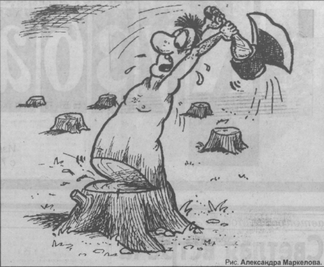
Рис. Александра Маркелова.

куда теперь ждать денег — никому не понятно. Ученые, привыкшие уже к кулишам вместо денег, продолжают начатую работу.