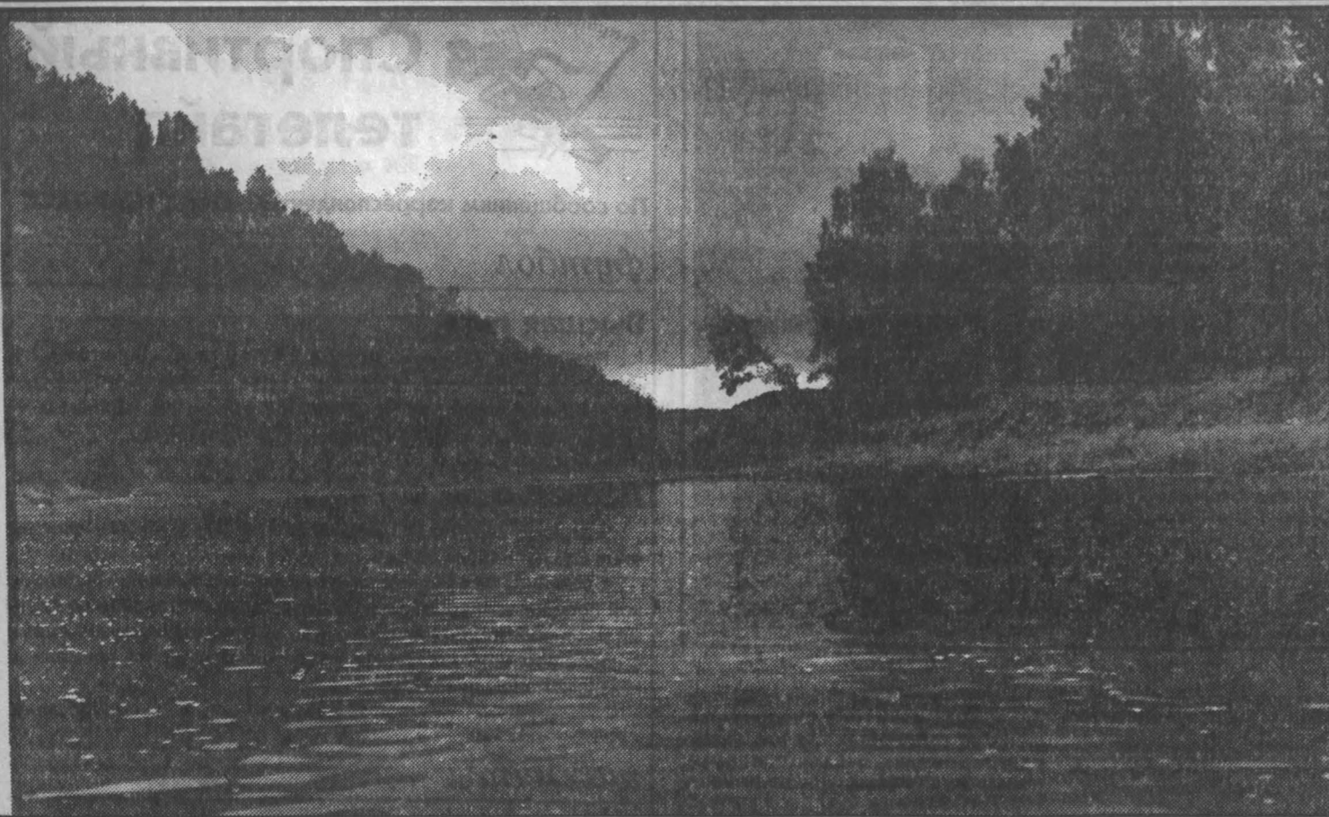
Вечер на Тайдоне.