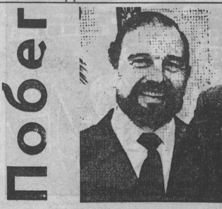
Рассказ английского разведчика, ставшего гражданином СССР

Если бы судья потребовал 14 лет тюремного заключения, то я бы вылетел большую тюрьму и шок. Взяв 42 года и отсидев столько, его тем не менее можно считать, что я не вылетел тюрьму. Но 42 года звучат как непереносимое наказание, за этот срок может так много случиться, что и невольно забываешь. Мне казалось, что совершенно непереносимым.