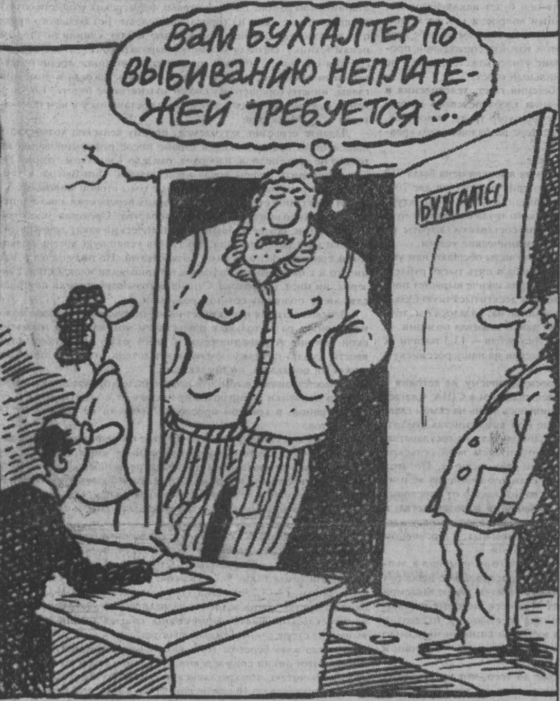
Рис. В. Ненасеева.