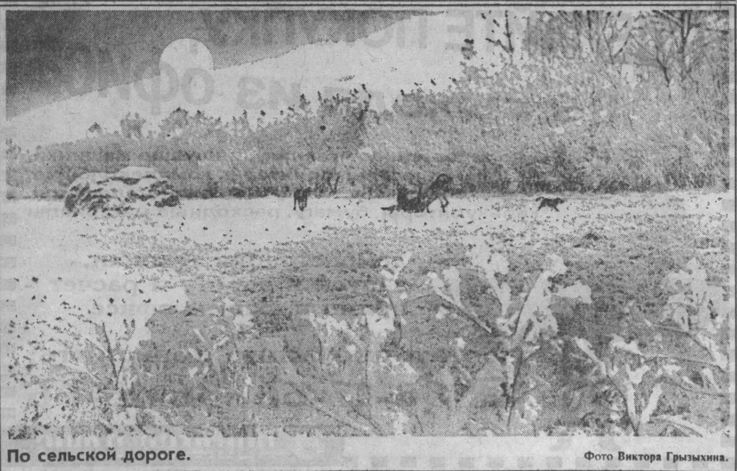
По сельской дороге.