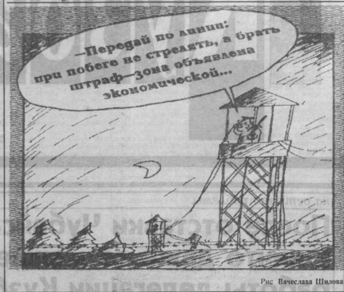
Рис. Вячеслава Шилова.

Спрашиваю у секретари комиссии В. Воробьева, а не пора ли всеобщим в городе порядке с торговлей, особенно частной, буквально загноившей в гроб население производящей откровенно отрицательного качества? Не пора ли нещадно отбирать лицензию на право торговли у журиющихся на нашем здоровье коммерсантов? «Сделать это можно только через суд», — слышу в ответ. «Ну, так создайте хоть один президент!» «Только себе накладно будет».