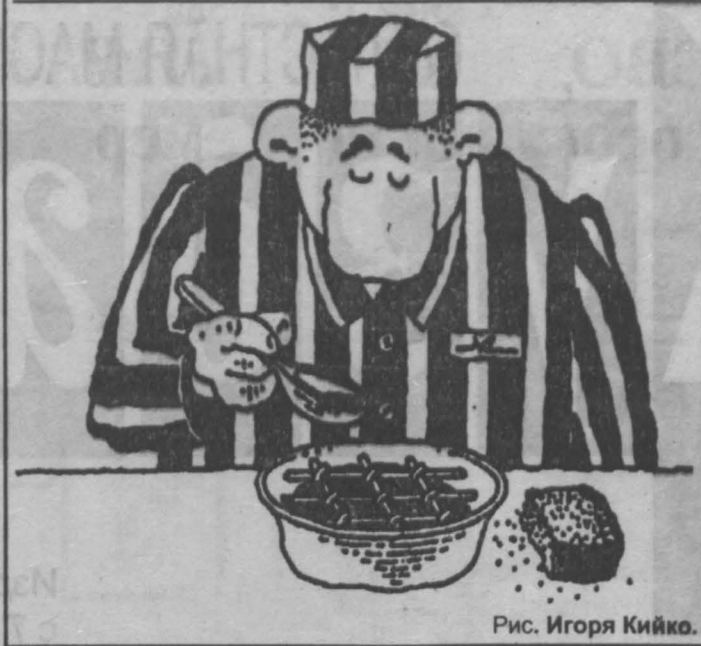
Рис. Игоря Кийко.