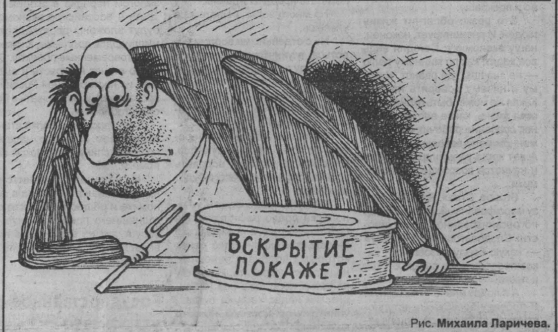
Рис. Михаила Ларичева.