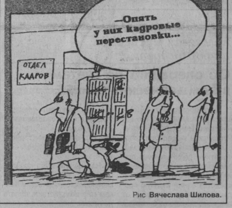
Рис Вячеслава Шилова.