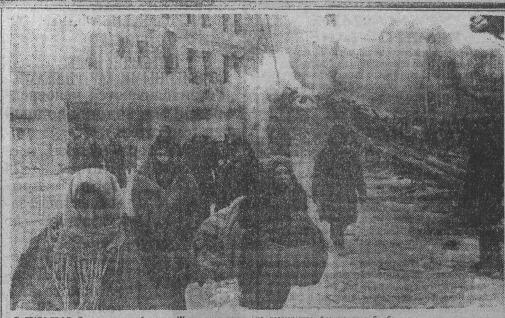
Ленинград в дни блокады. Жители покидают дома, разрушенные фашистскими бомбами.