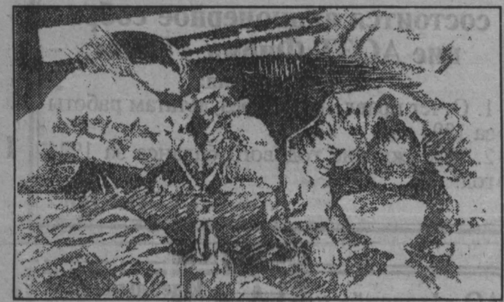
Рис. В. Архипова