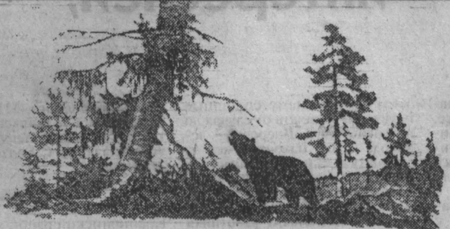
Очередной выпуск спешно-леса «Край родной» Рис В.Архипова.