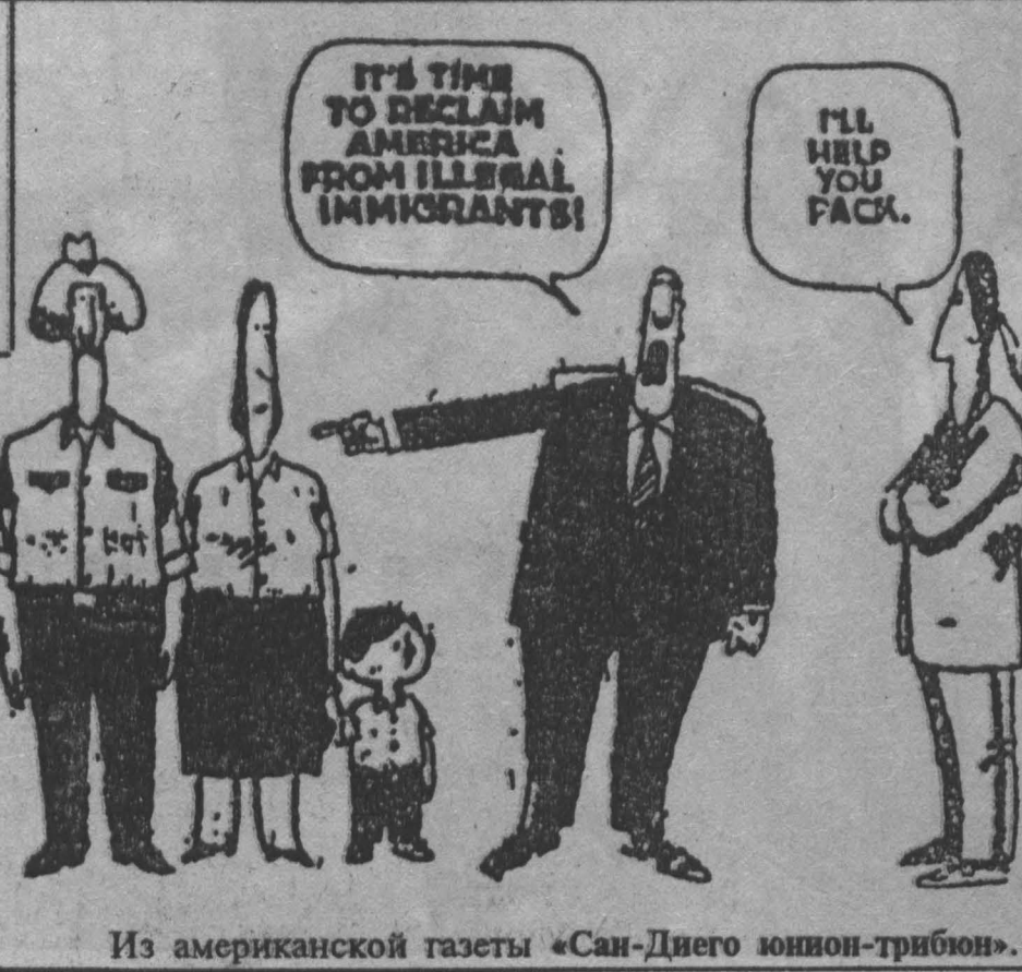
Из американской газеты «Сан-Диего юнион-трибюн».

По сути, в политическом требования «прорабы» недалекие ушли от своих давних предшественников — «февральских демократов» 17-го года. Ведь те тоже благоговейно царский манифест 17 октября 1905 г., разрывавший основные буржуазно-демократические свободы печати, собраний, верноподданнических, право поездок за границу для всех сословий и т. д.