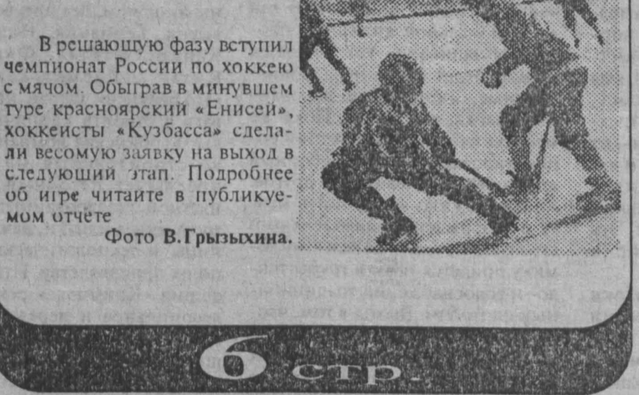
В решающую фазу вступил чемпионат России по хоккею с мячом. Обыграв в минувшем туре красноярский «Енисей», хоккеисты «Кузбасса» сделали весомую заявку на выход в следующий этап. Подробнее об игре читайте в публикуемом отчете.