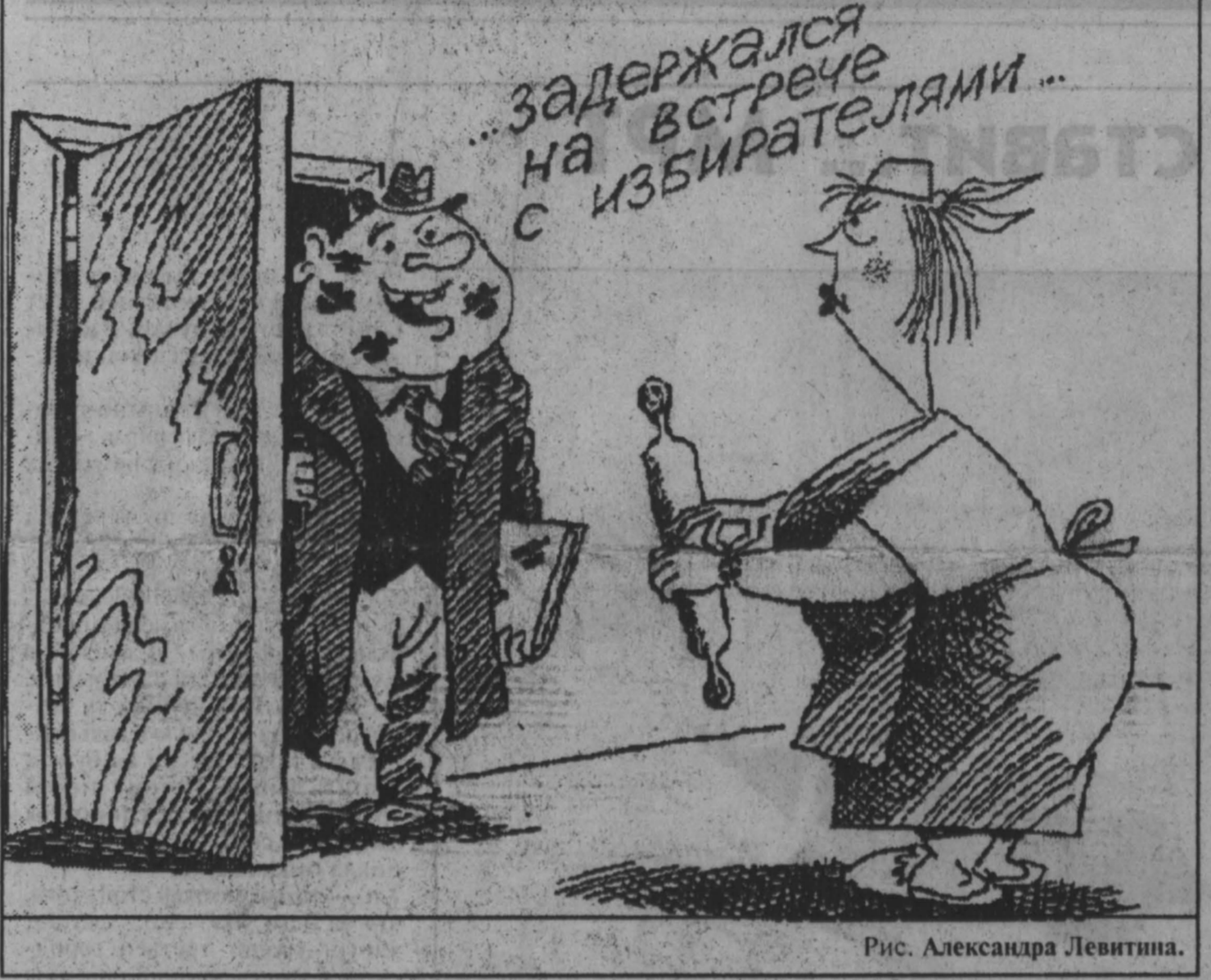
Рис. Александра Левитина.