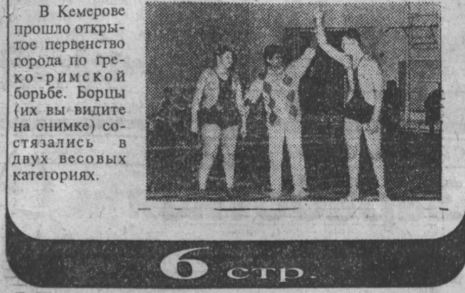
В Кемерове прошло открытое первенство города по греко-римской борьбе. Борцы (их вы видите на снимке) состязались в двух весовых категориях.