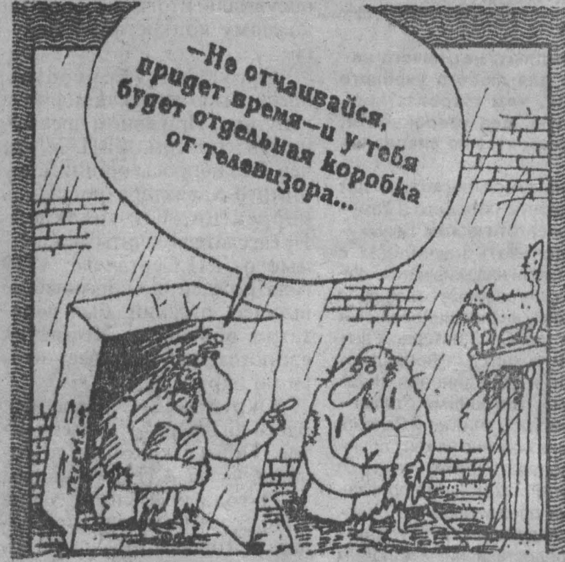
Рис. В. Шиндлер.