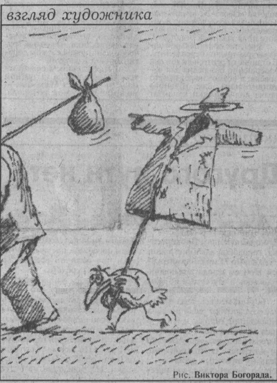
Рис. Виктора Богорада.