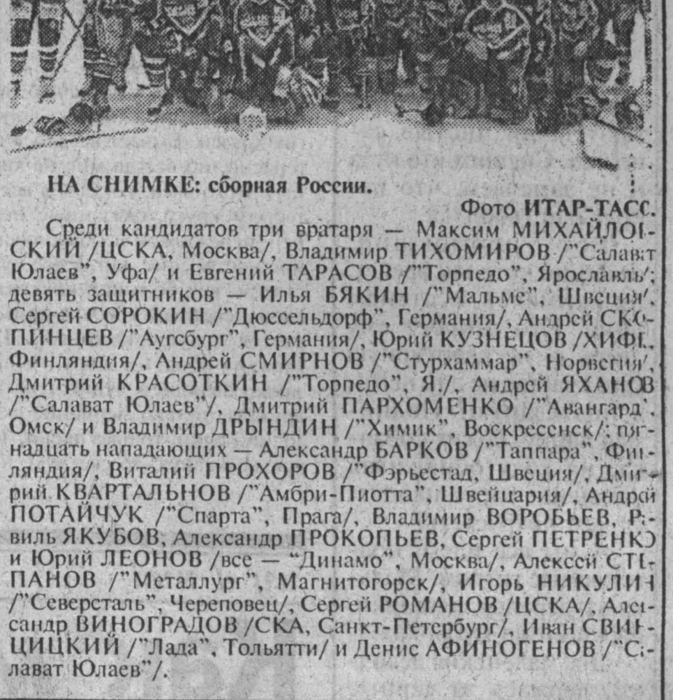
НА СНИМКЕ: сборная России.