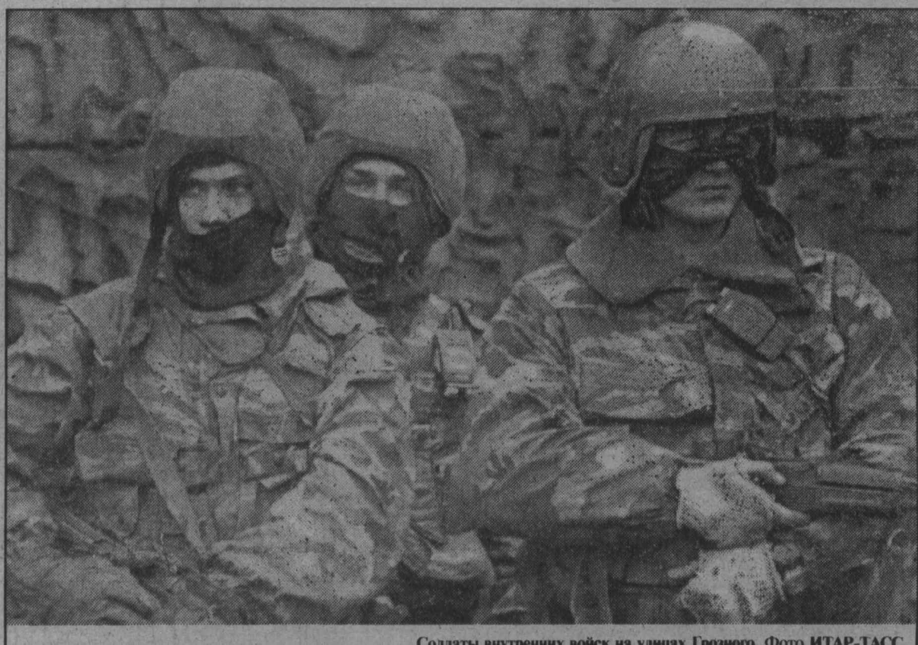
Солдаты внутренних войск на улицах Грозного.