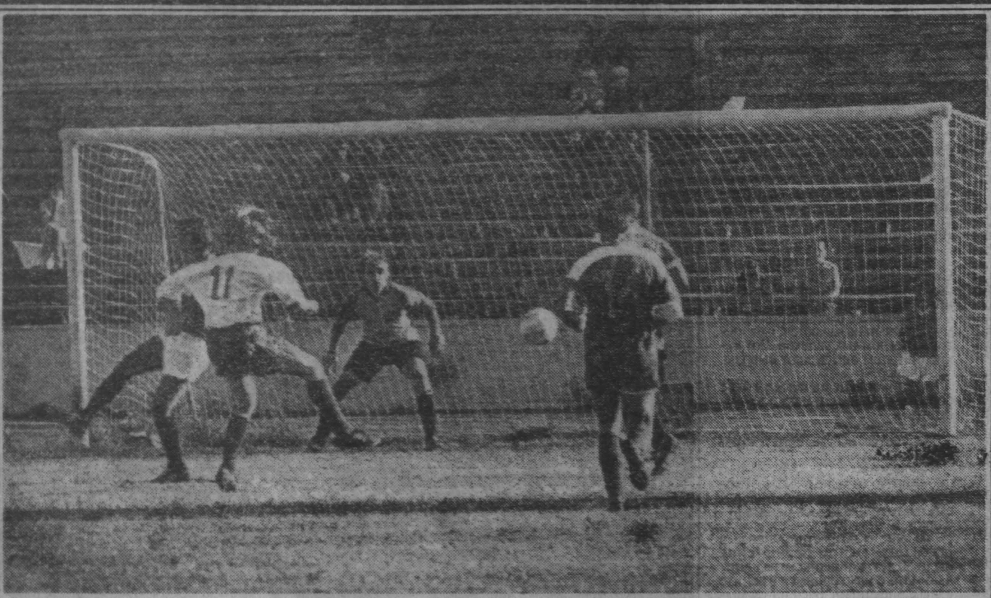
Воспоминание о лете.