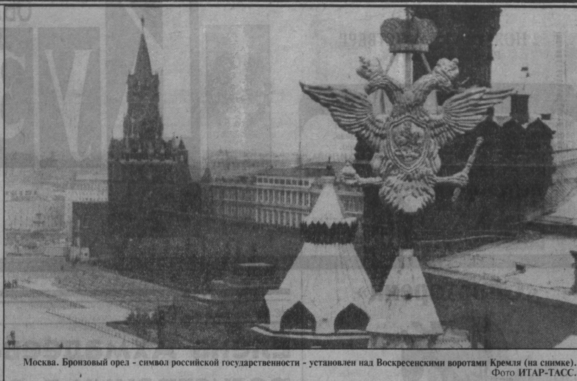
Москва. Бронзовый орел - символ российской государственности - установлен над Воскресенскими воротами Кремля (на снимке).

Неужели, чтоб убедить правительству в некорректности таких обвинений, кому-то из сидящих на совете надо в следущий раз опять оказаться в одном вертолете с высоким господином из Кремля? Ведь как ни говори, но руководство страны сегодня как бы и само состоит в организаторах той «пирамиды» — неплатежи по контрактным объектам «Кузбассшхтострой» за 9 месяцев равны 56 из 140 подписанных миллиардов!