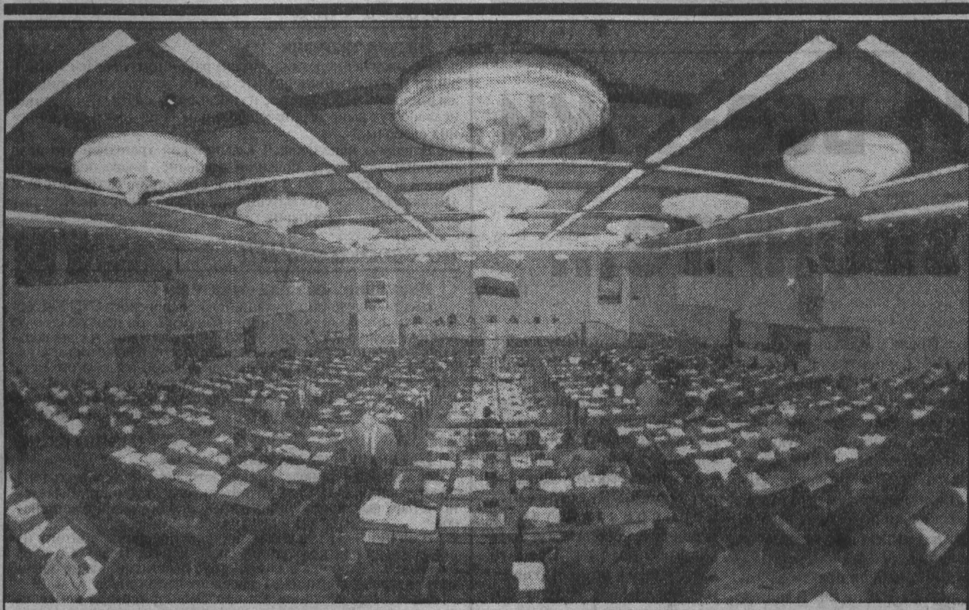
МОСКВА. Зал заседаний Государственной думы.