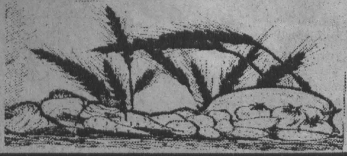
Рис. Валерия АРХИПОВА.

Многие хозяйства области собрали неплохой урожай овощей и корнеплодов. Но вырастить — это полдела. Сейчас важнее сохранить и реализовать продукцию.