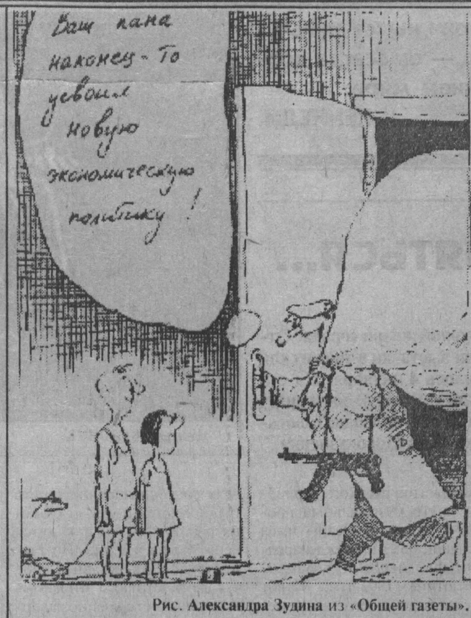
Рис. Александра Зулина из «Общей газеты».