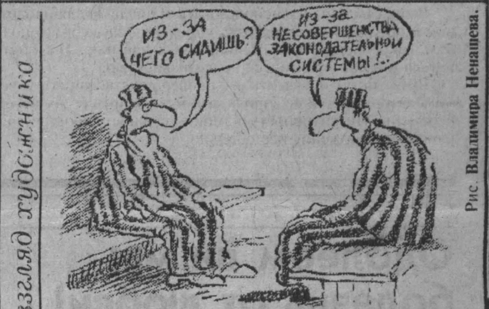
Рис. Владимир Шеняев.

Эти «охотники» в поисках своих трофеев не гонятся за дичью по лесу и тайге. Не бьют ноги... Принцип их «работы» прост: «подехал на автомашине к пасущемуся стаду, зарезал откормленного бычка или корову — мясо в кузов, и был таков...» В миллионских сводках сообщения подобного рода, увы, в последнее время не редкость. За первую декаду сентября только на пастбищах Ленинск-Кузнецкого района произошло шесть криминальных эпизодов. Одна из преступных групп, которую обезвредили милиционеры РОВД, забила уже 20 голов скота! Шесть нападений «мясозаготовителей» зарегистрировано в Кемеровском районе. Трех преступников оперативники подкараулили в районе поселка Звездный, где взяты они были с подличным — в кузове вездехода «ГАЗ-66» обнаружено сразу четыре туши. Для усиления борьбы с расхитителями по районам области больше стало курсировать моторизованных ночных патрулей. В Кемеровском районе их два. С. КУЗНЕЦКИЙ.