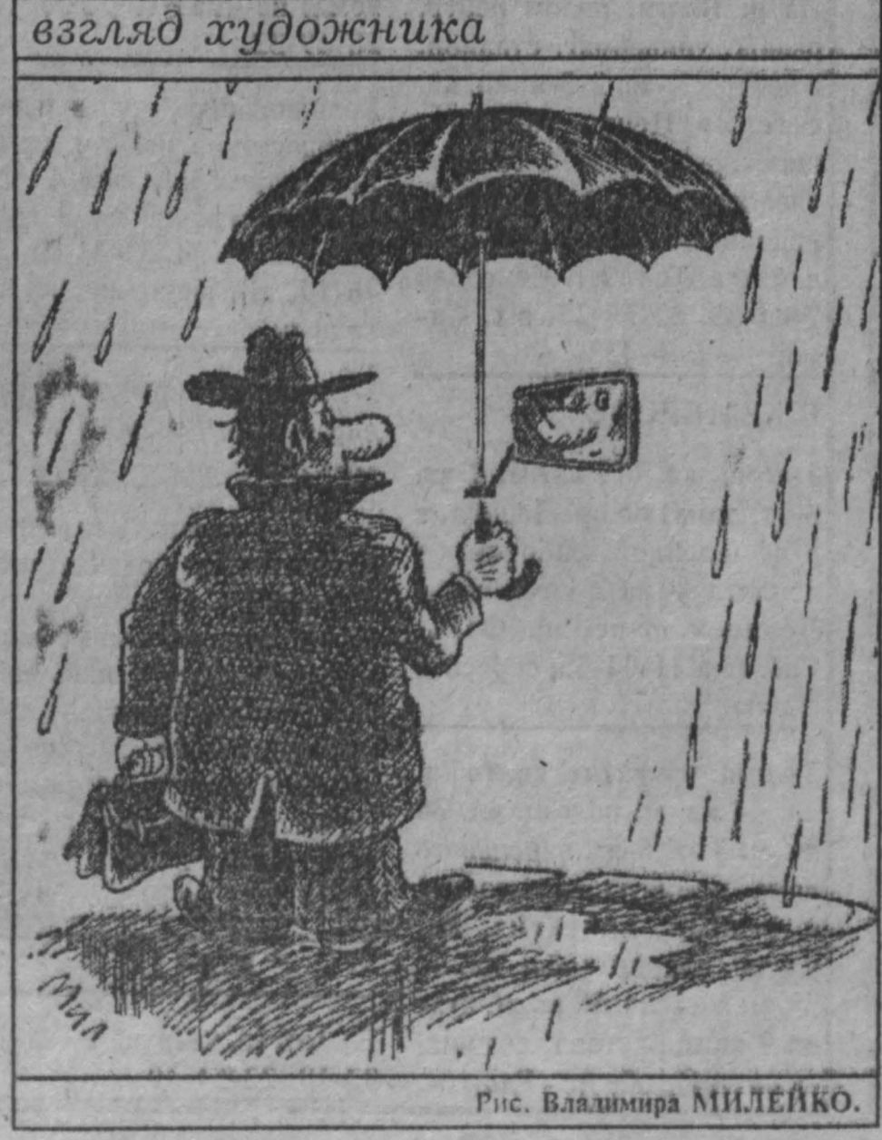
взгляд художника. Рис. Владимира МИЛЕЙКО.

На многострадальный берег Беловского водохранилища даже из Ленинского Кузнецкого привозят битые стиральные машины, валяются в дорожку. Запреты, штрафы и санкции не действуют, несмотря на то, что к баням экологического назначения и рыболовецким. Да и то сказать: максимальный штраф за нарушение всего 50 тысяч рублей — плата символическая за антиэкологичный и антиэкономичный прилив мусора отсюда.