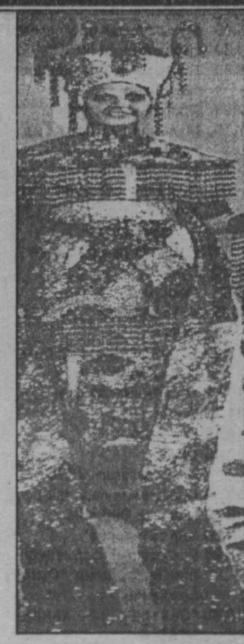
Микки Мак ГИР.