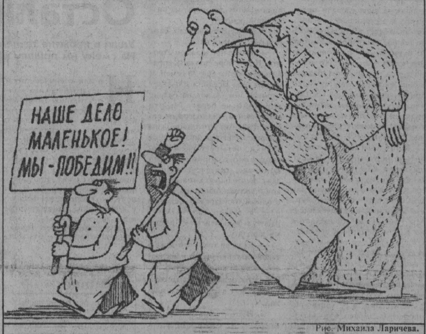
Рис. Михаила Ларичева.