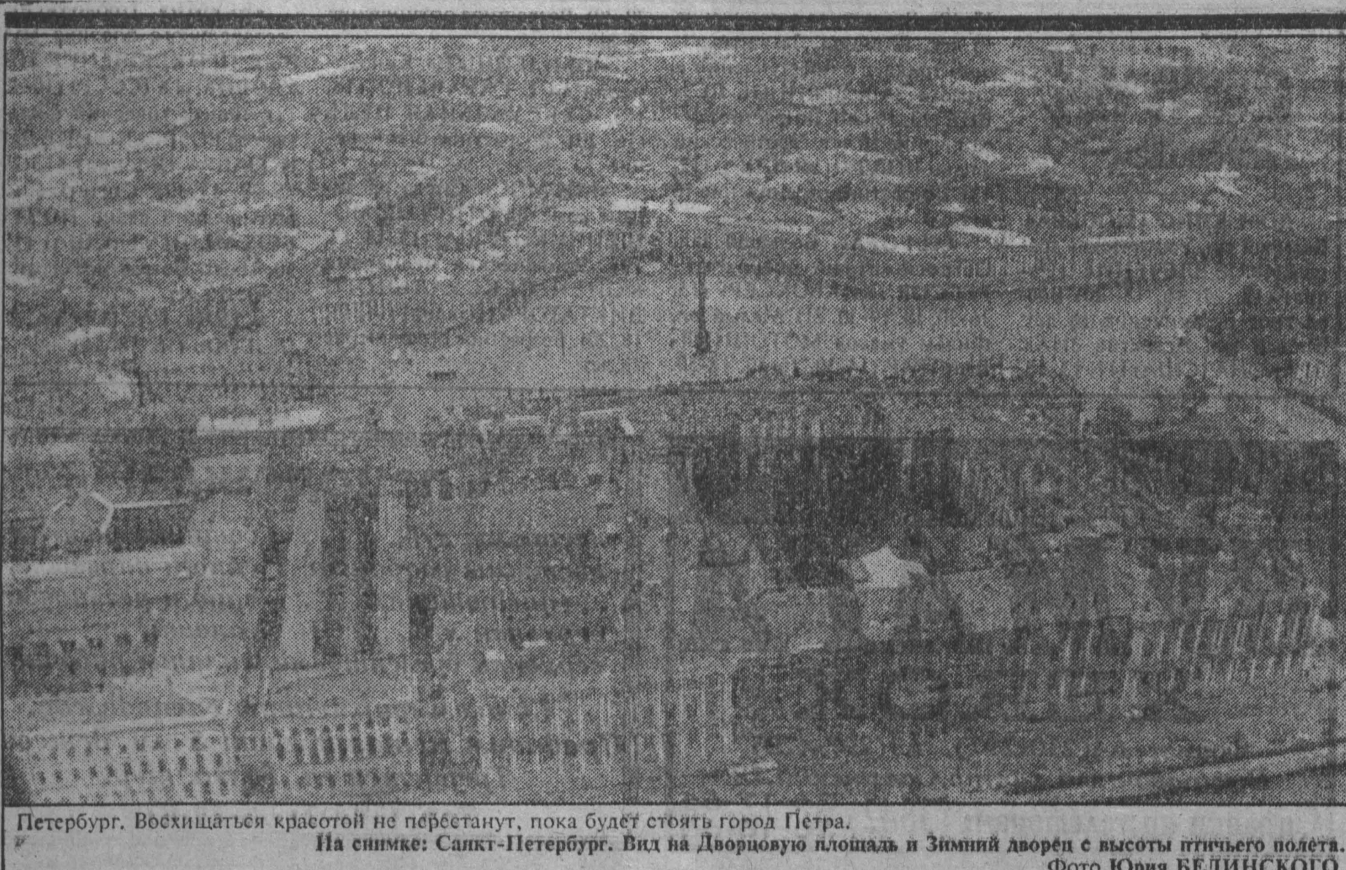
Петербург. Восхищаться красотой не перестанут, пока будет стоять город Петра. На снимке: Санкт-Петербург. Вид на Дворцовую площадь и Зимний дворец с высоты птичьего полета.