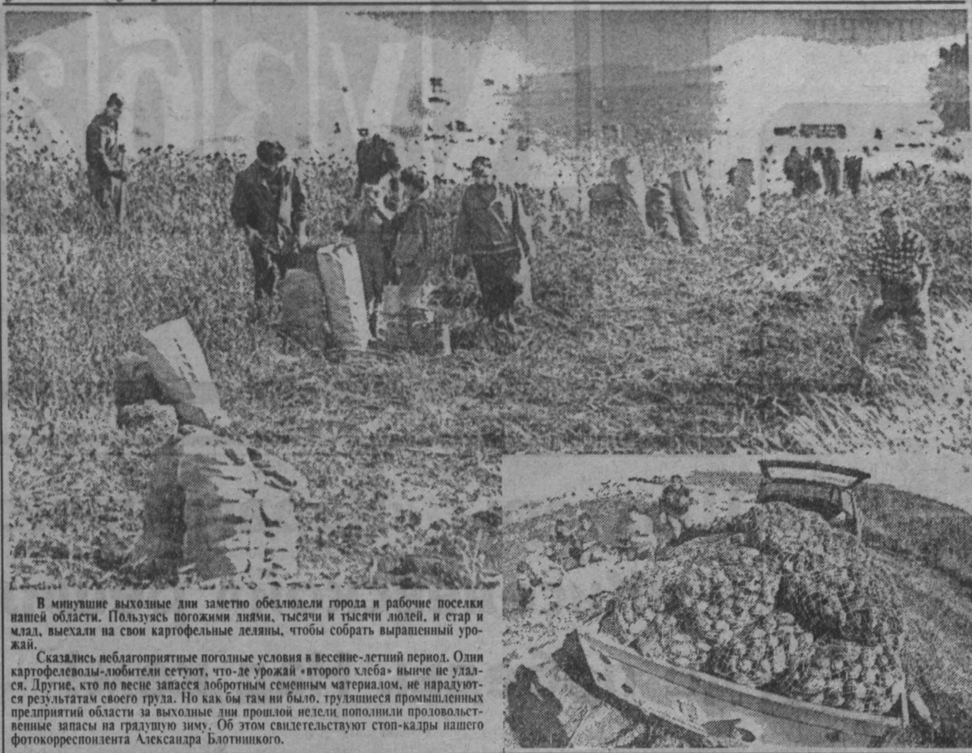
В минувшие выходные дни заметно обеспокоили города и рабочие поселки нашей области. Пользуясь погожими днями, тысячи и тысячи людей, и стар и млад, выехали на свои картофельные делянки, чтобы собрать выращенный урожай. Сказались неблагоприятные погодные условия в весенне-летний период. Оли картофельселевды-любители сетуют, что урожай «второго хлеба» нынче не удался. Другие, кто по весне запасся добротным семенным материалом, не на радостях результатами своего труда. Но как бы там ни было, труженики промышленных предприятий области за выходные дни прощали несли пополнили продовольственные запасы на грядущую зиму. Об этом свидетельствуют стоп-кадры нашего фотокорреспондента Александра Болтинского.