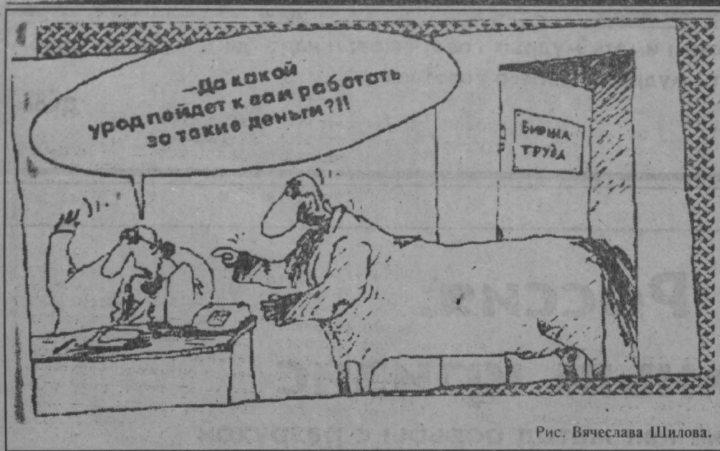
Рис. Вячеслава Шилова.