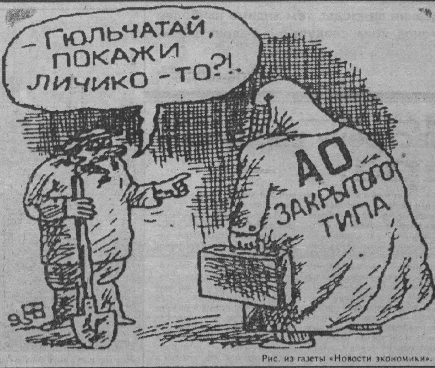
Рис. из газеты «Новости экономики».