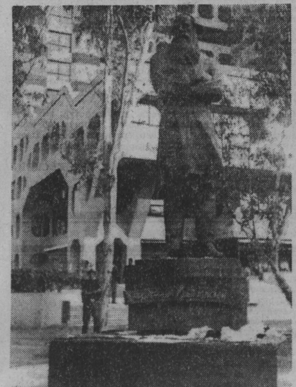
Индия. Памятник Льву Толстому открыт в Дели. Он установлен на одной из центральных улиц города носящей имя великого русского писателя. Авторы выполненной в бронзе скульптурной композиции — народный художник России Ю.Л Чернов и архитектор А.К Тихонов.

Реализуем оптом и в розницу со склада в Москве ЮГОСЛАВСКИЕ ОБОИ. Бумажные, дуплекс, виниловые — влагостойкие и моющиеся Европейское качество Доступные цены Приглашаем к сотрудничеству магазины и торговые фирмы Ишем плетров Отпечатаем — система скидок Форма оплаты любая Помощь в доставке Тел (095) 396-82-65, 465-37-41, с 9 до 21 часа, кроме выходных