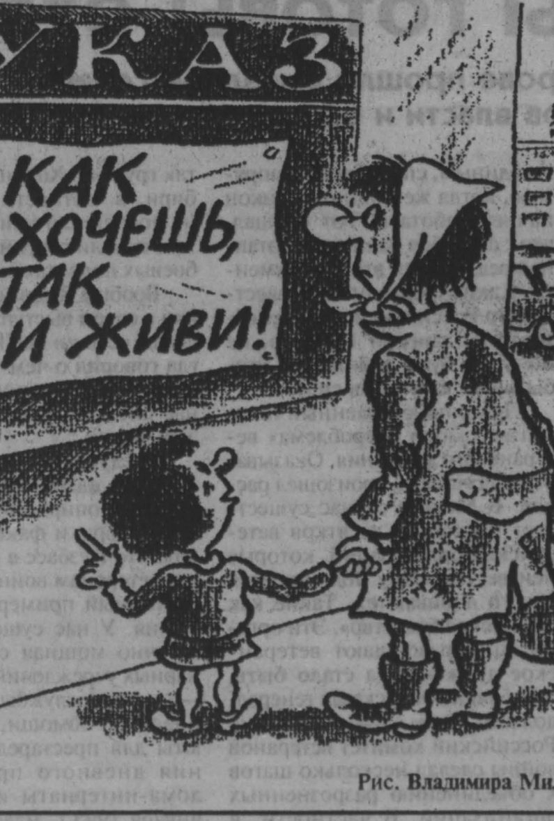
Рис. Владимира Милейко.