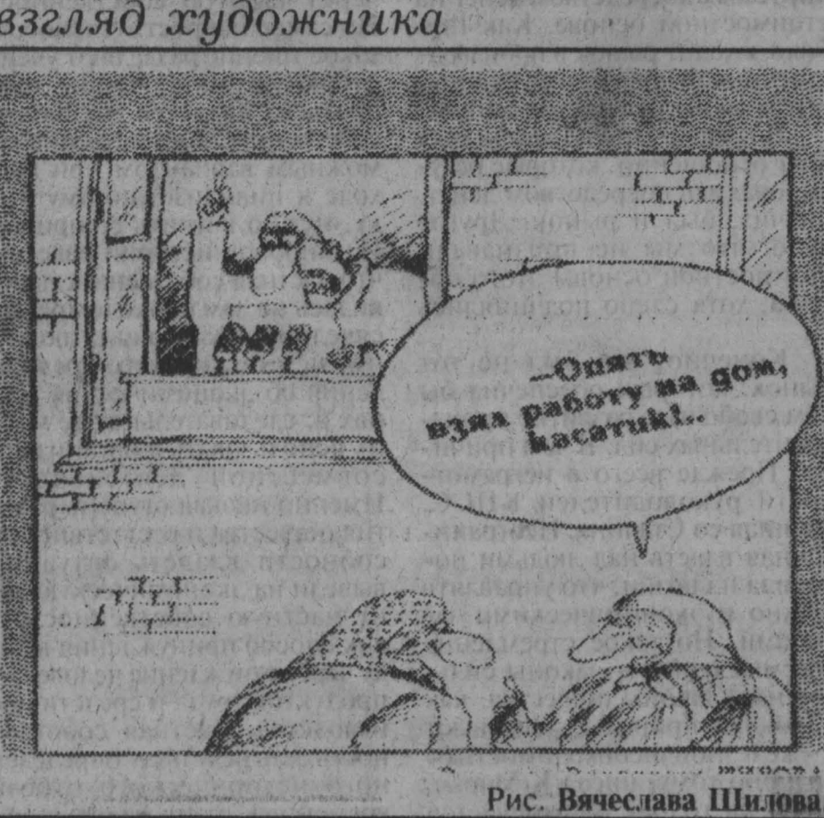
Рис. Вячеслава Шидлова.

Если не вдаваться в детали, с доводом сокращения расходов на выборную кампанию вроде можно согласиться. Но, проведя зримую и театральную аналогию, скажем, с совмещением сроков строительства крупной городской автомагистрали и параллельной линии скоростного трам-