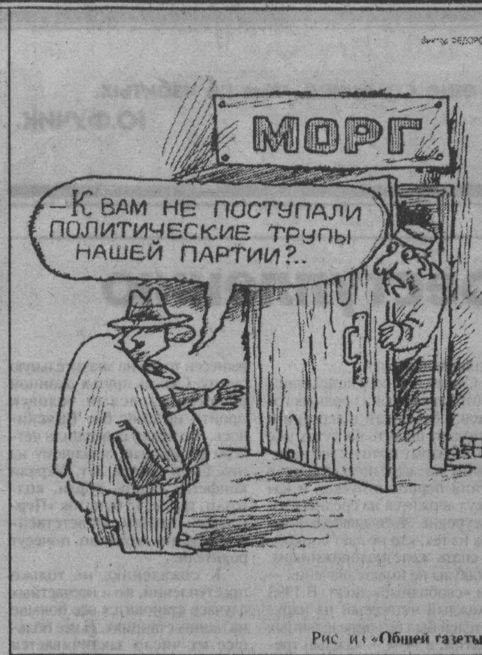
Рисунки «Общей газеты».

блема, и евреи стали выжидать, чтобы увидеть, какие здесь про-