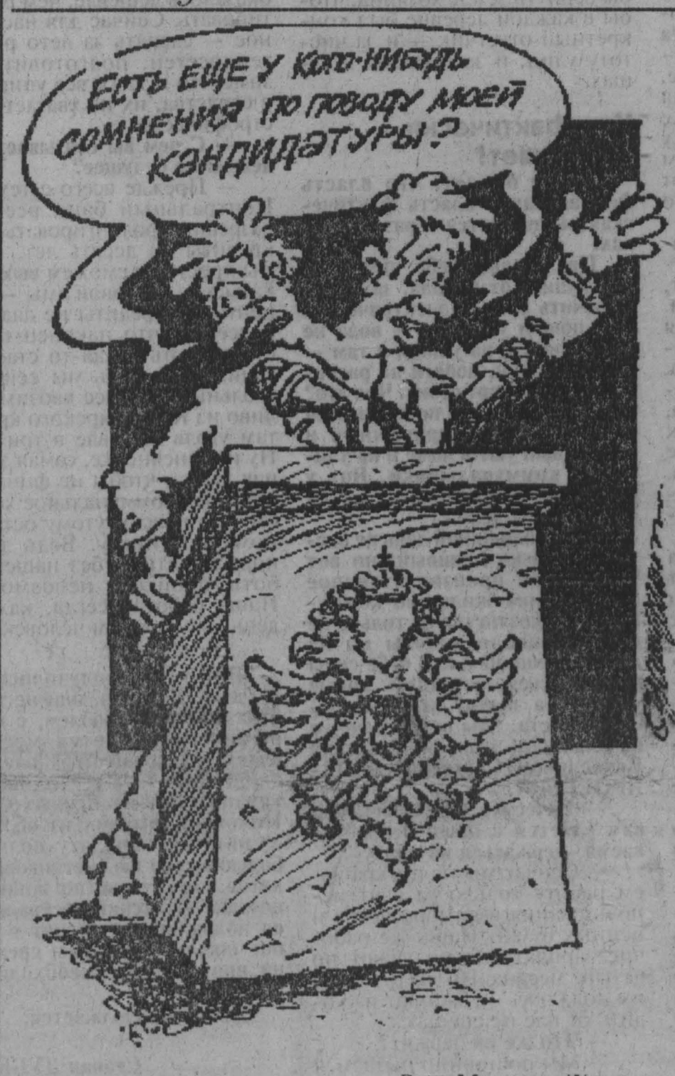
Рис. Михаила Жилкина.