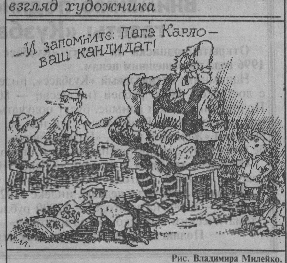
Рис. Владимира Милейко.