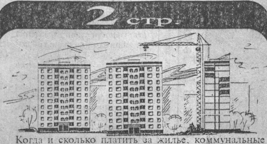
Когда и сколько платить за жилье, коммунальные услуги и телефон.