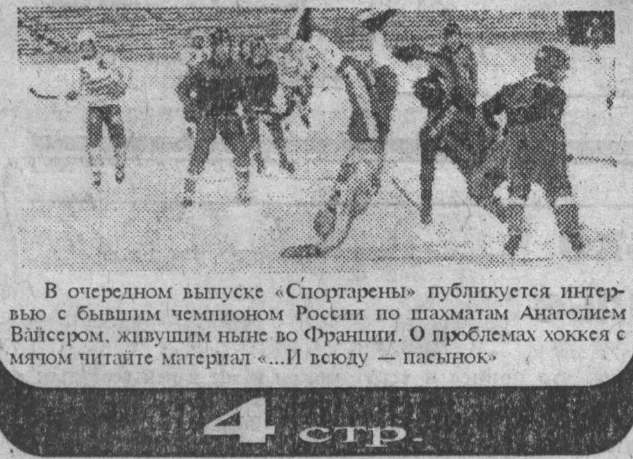
В очередном выпуске «Спортарены» публикуется интервью с бывшим чемпионом России по шахматам Анатолием Вайсером, живущим ныне во Франции. О проблемах хоккея с мячом читайте материал «...И вскоду — пасынок»