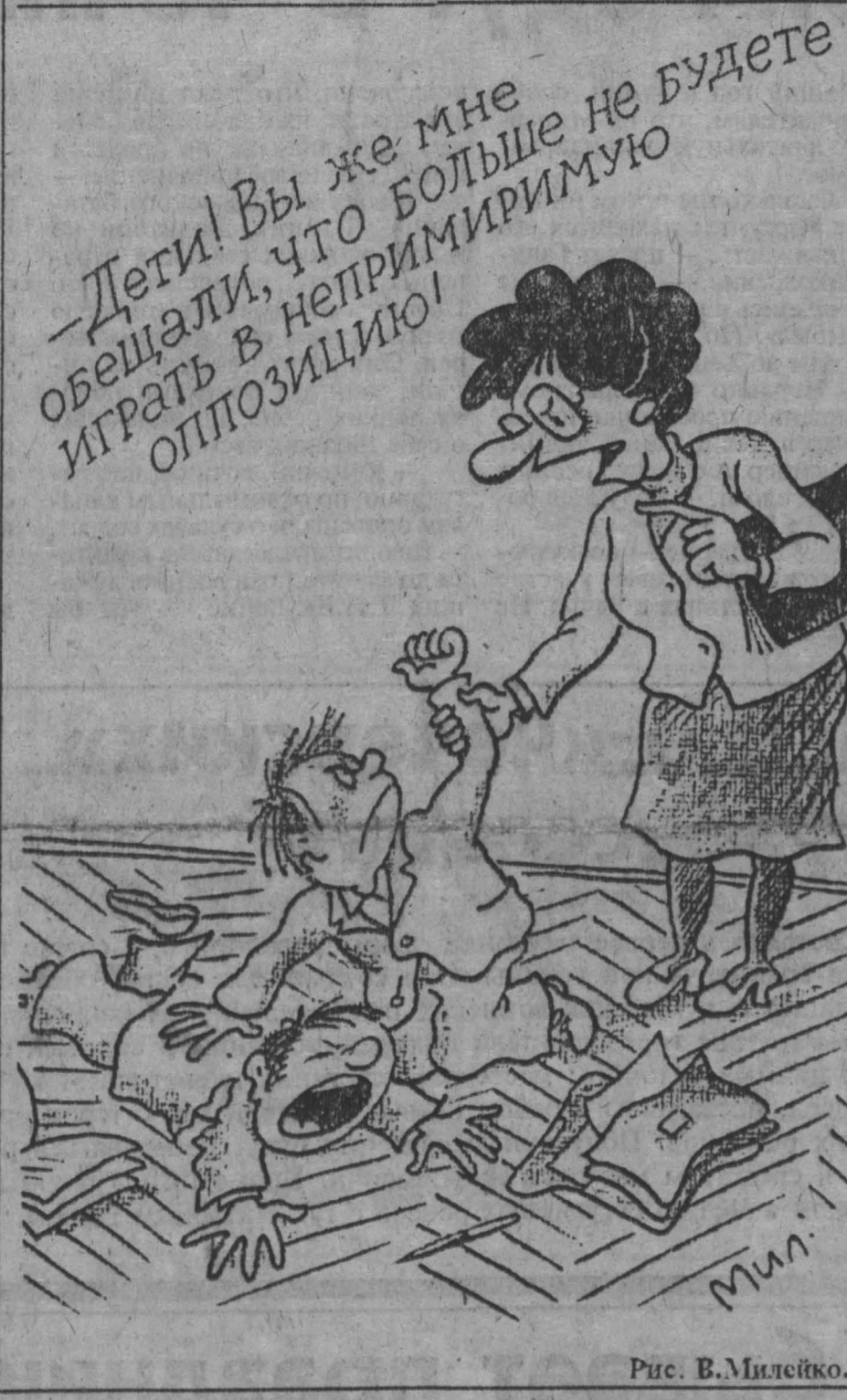
Рис. В. Милейко.