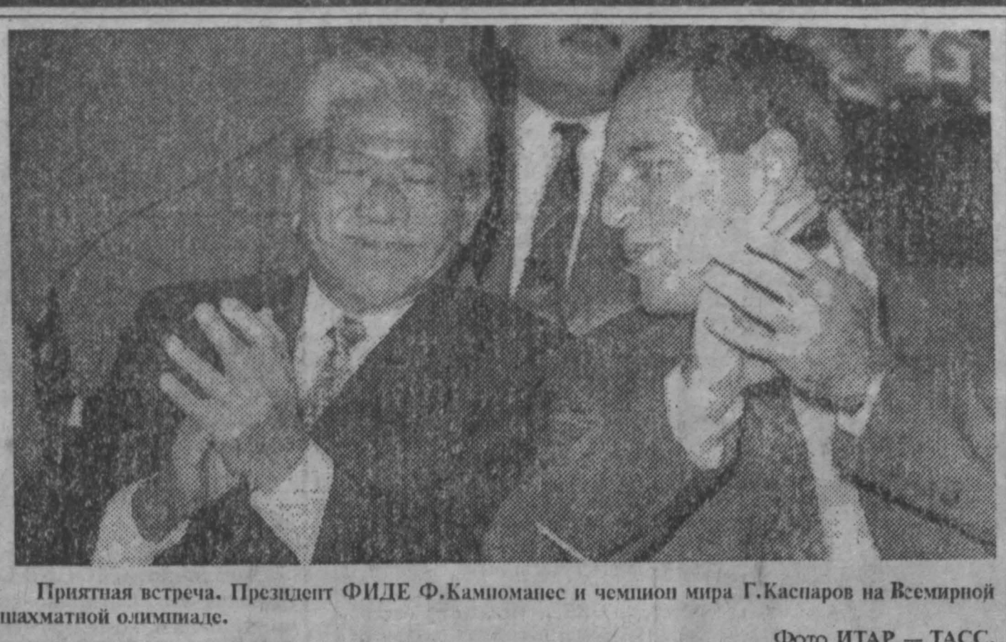
Приятная встреча. Президент ФИДЕ Ф. Каммонес и чемпион мира Г. Каспаров на Всемирной шахматной олимпиаде.

Распоряжение о проведении XI зимней Спартакиады Кузбасса, посвященной 50-летию Победы в Великой Отечественной войне. В целях укрепления здоровья, улучшения активного отдыха трудящихся, развития материальной базы физической культуры и спорта в городах области и в связи с 50-летием Победы в Великой Отечественной войне: 1. Провести финальные соревнования XI зимней Спартакиады Кузбасса с 26 февраля по 5 марта 1994 года в городах: Новокузнецке — коньки, хоккей; Таштаголе — горные лыжи; Гурьевске — лыжные гонки; Ленинске-Кузнецком — хоккей с мячом; Прокопьевске — прыжки на лыжах с трамплина и лыжное двоеборье. 2. Рекомендовать главам администраций организовать проведение Спартакиады на своих территориях и обеспечить участие сборных команд городов в финальных соревнованиях XI Спартакиады Кузбасса. 3. Комитету по физической культуре и спорту администрации области (А.Н. Ходаковский) разработать и утвердить положение о Спартакиаде, обеспечить качественное проведение Спартакиады, рекламу и пропаганду в средствах массовой информации. 4. Контроль за проведением XI зимней Спартакиады Кузбасса, посвященной 50-летию Победы в Великой Отечественной войне, возложить на заместителя главы администрации И.Ф. Федорову. М. КИСЛЮК, глава администрации.