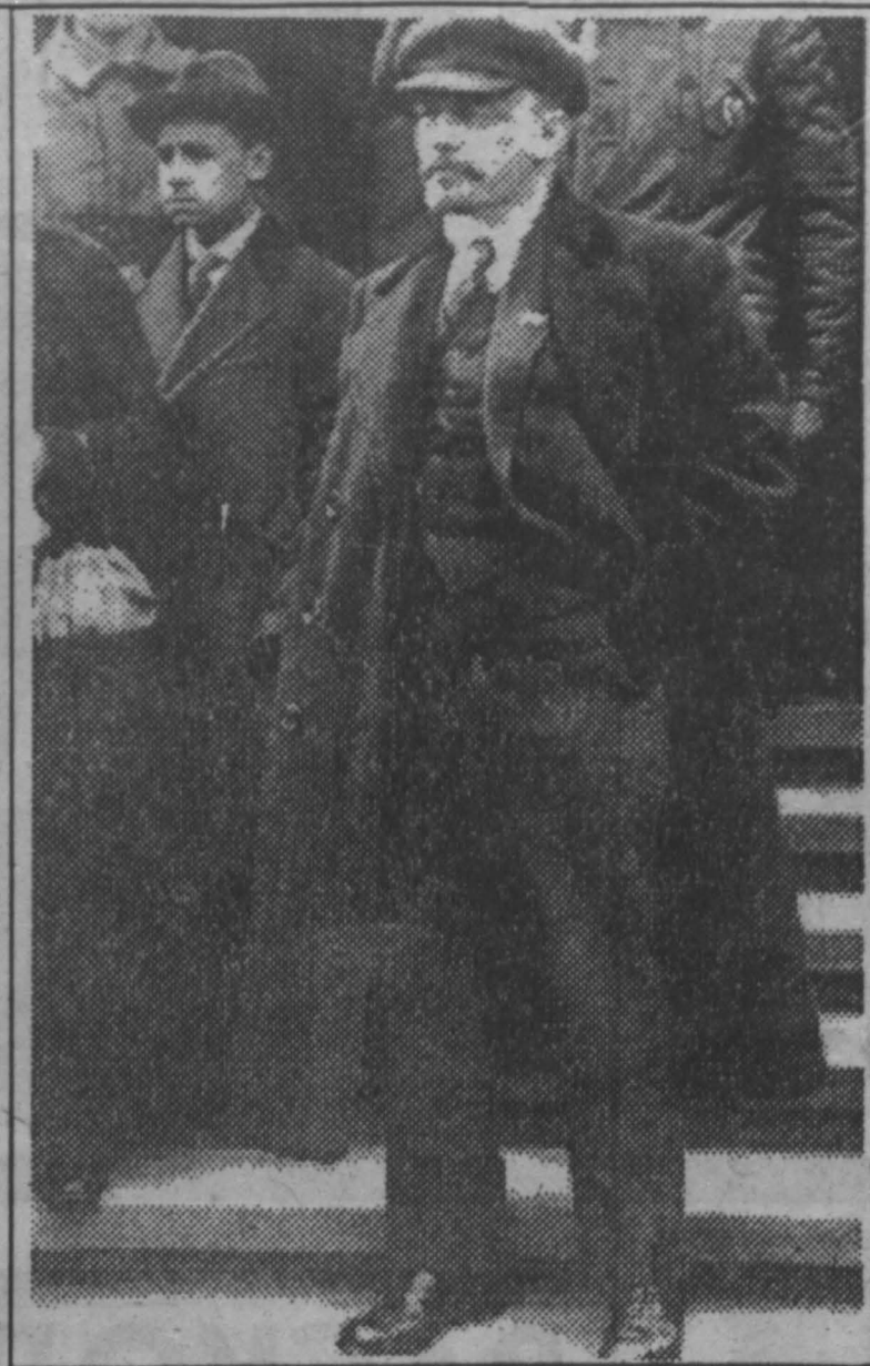
День памяти В.И.Ленина. В.И.Ленин на Красной площади во время демонстрации 1 Мая 1919 года.