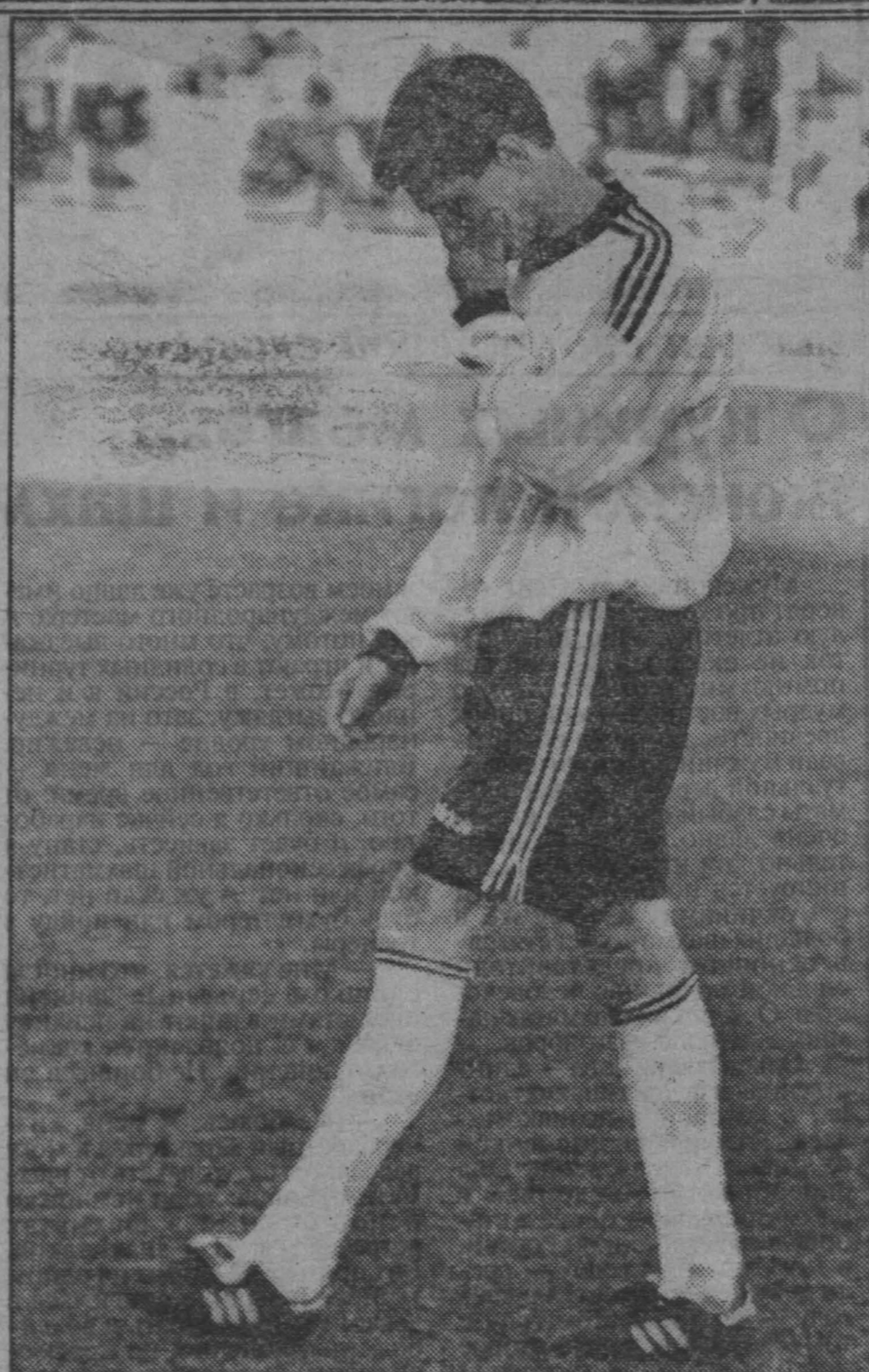
Неудавшийся матч.

Ответ оставим до следующей встречи, но теперь уже в областном центре. В. МАЛЫШЕВ, специально для «Спортарены», г. Новокузнецк.