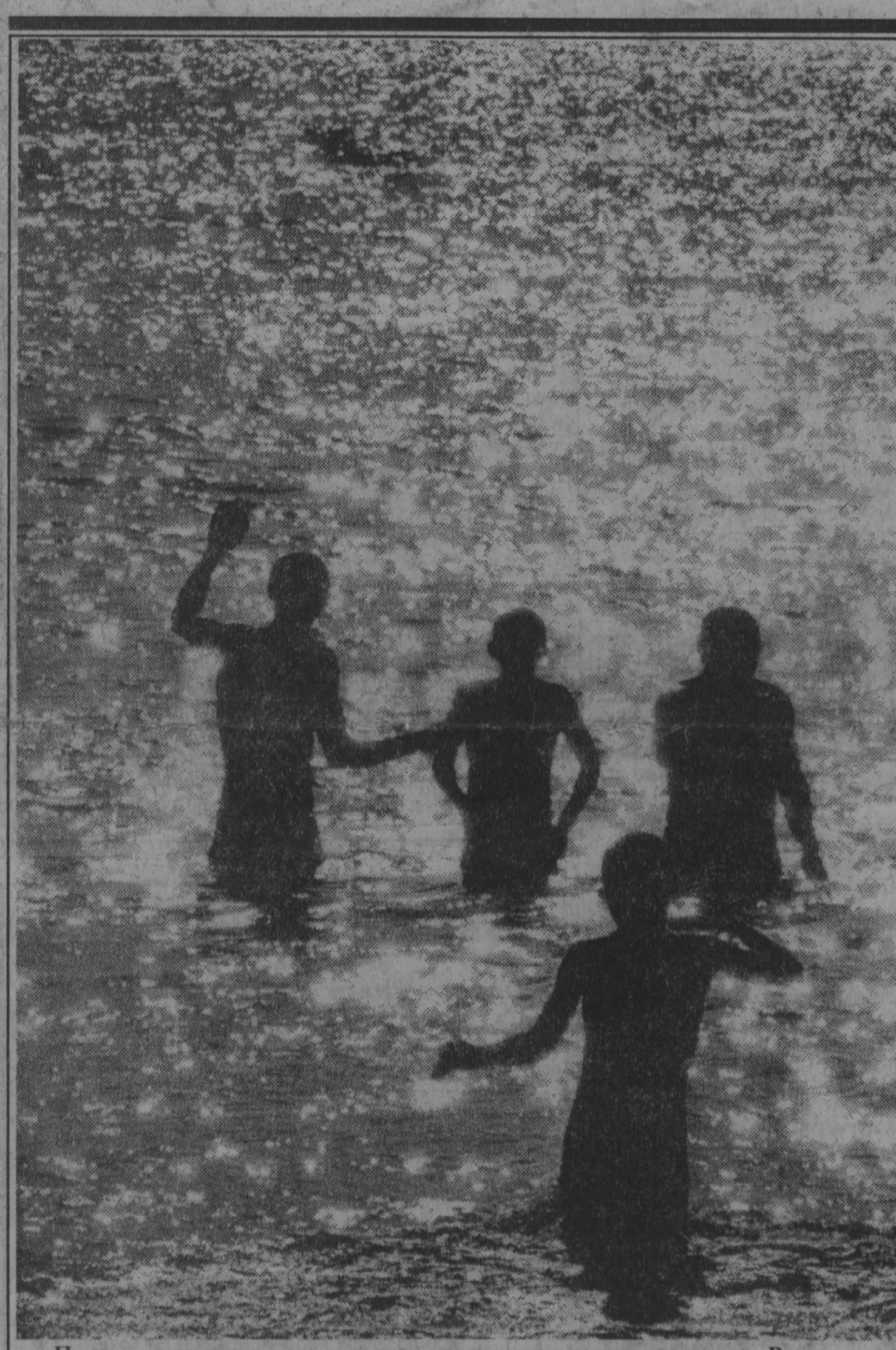
Похоже, лето наступило окончательно: солнечно, тепло и радостно. Все — в лес, на реку, в горы. Приятного отдыха!